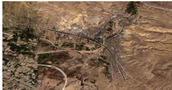
شکل ۲. نقشه هوایی شهر بستان آباد [۳۰].