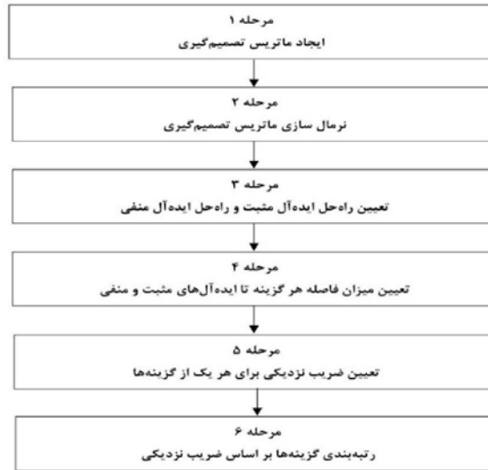
شکل (۴) مراحل انجام کار در تکنیک تاپسیس (ترسیم: نگارندگان)

راه‌حل ایده‌آل، راه حلی است که بیشترین سود و کمترین هزینه را داشته باشد، در حالی که راه حل غیر ایده‌آل، راه حلی است که بالاترین هزینه و کمترین سود را داشته باشد. مراحل انجام کار در تکنیک تاپسیس در شکل (۵) نمایش داده شده است. حال مطابق با مراحل ذکر شده، رتبه‌بندی محلات شهر یزد بر اساس سه معیار مشارکت، کیفیت زندگی و امنیت انجام شده است.