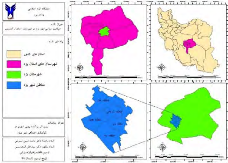
نقشه (۱): موقعیت شهر یزد در تقسیمات کشوری (ترسیم: نگارندگان)