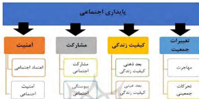
شکل (۲): مؤلفه، معیار و زیر معیارهای تعیین کننده پایداری اجتماعی

پارادایم مرتبط با موضوع تحقیق نظیر توسعه پایداری شهری از منظر بعد اجتماعی استفاده شده است. برای جمع‌آوری داده‌های پایداری اجتماعی پرسشنامه استفاده شده است. جهت ارزیابی و سنجش وضعیت پایداری محلات شهر یزد بر اساس متغیرهای تحقیق از روش تاپسیس استفاده شده است. با توجه به نظریه‌های بیان شده در ارتباط با پایداری اجتماعی و پیشینه‌های ارائه شده در این زمینه، سعی شده است شاخص‌ها و متغیرهای مورد نیاز در این مقاله به شرح زیر انتخاب و مورد بررسی قرار گیرد.