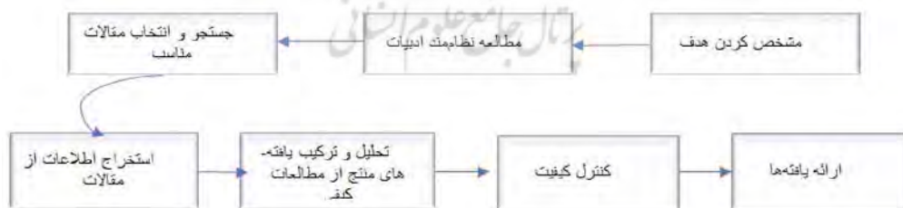
شکل ۱: مراحل و روش کلی فراترکیب (ساندلوسکی و باروسو، ۲۰۰۷)

در پژوهش از روش کیفی فراترکیب استفاده شده است. فراترکیب، نوعی مطالعه کیفی است که از اطلاعات و یافته‌های مطالعات دیگر با موضوع مرتبط و مشابه استفاده می‌کند. فراترکیب، ترکیب تفسیرهای داده‌های اصلی مطالعات منتخب است (زیمر، ۲۰۰۶: ۳۱۰). پژوهش از نظر هدف، کاربردی و از نظر گردآوری داده‌ها، کیفی است که با روش پژوهش کتابخانه‌ای از نوع مطالعات ثانویه و فراترکیب صورت گرفته است. تجزیه و تحلیل اطلاعات در چند مرحله انجام شده است. در مرحله اول با بررسی کامل ادبیات پژوهش، فهرستی از مقالات مرتبط با این حوزه و حتی مقالاتی که به طور فرعی به این موضوع پرداخته‌اند، تهیه شده است. در مرحله دوم، چکیده این مقالات استخراج و دسته بندی و در مرحله سوم با استخراج عناصر کلیدی، ترکیب نهایی انجام و تحلیل و جمع‌بندی صورت گرفته است. مراحل و روش کلی هفت مرحله‌ای فراترکیب در شکل ذیل آورده شده است: