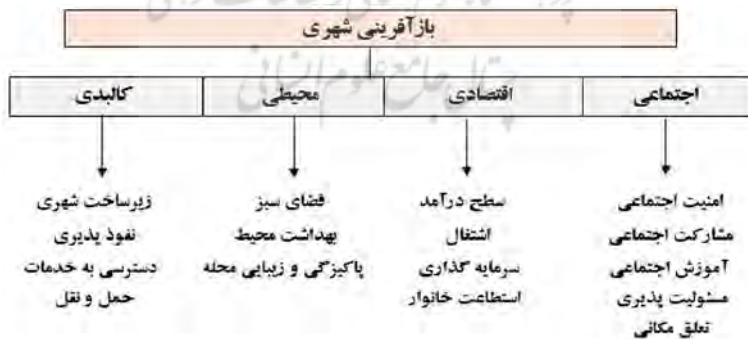
شکل (۲) شاخص‌های و عوامل بازآفرینی شهری بافت قدیم

سیاست‌های بازآفرینی شهری را می‌توان در چهار دسته کالبدی، محیطی، اقتصادی و اجتماعی دسته بندی کرد (Tallon, 2010, 46: Sasaki, 2010, 38: Ertan & Egercioglu, 2016, 602: Seo, 2002, 115). از این رو تدارک و اجرای یک برنامه بازآفرینی شهری، نیازمند کل نگر، همه جانبه نگری و توجه به ابعاد گسترده و پیچیده مسائل مبتلا به بافت‌های قدیمی شهری است. در شکل (۲) کلیه عوامل و شاخص‌های تحقیق نشان داده شده‌اند.