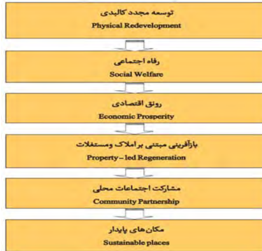
شکل (۱) تعامل بازآفرینی و توسعه پایدار