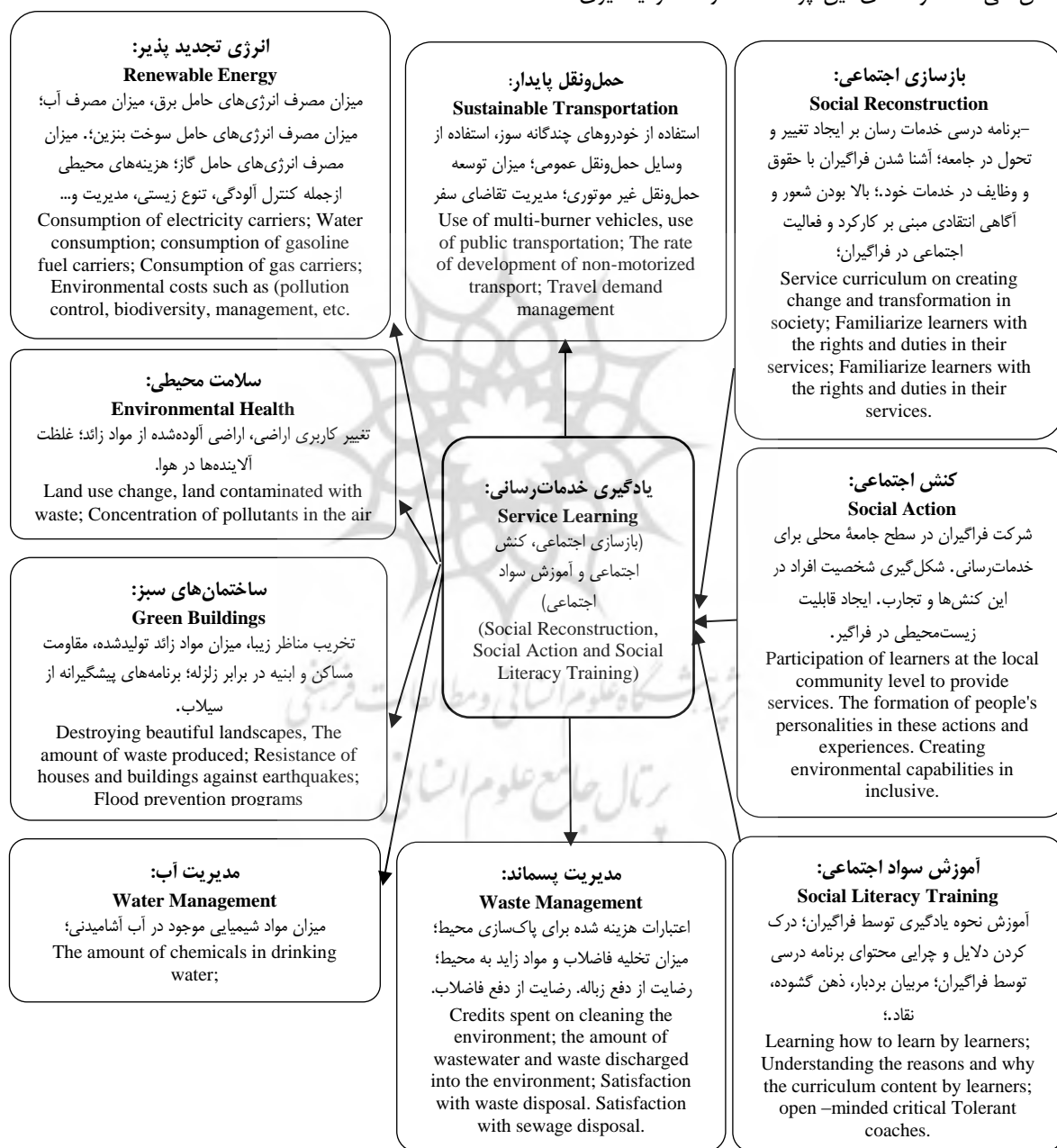
شکل ۱. الگوی پیشنهادی یادگیری خدمات رسان با تأکید بر اقتصاد سبز

این فرایند تضمین‌کننده روایی محتوایی و صوری پرسشنامه به کاررفته در این پژوهش بوده است و پرسشنامه مذکور برای استفاده نهایی در پژوهش مجوز لازم را به‌ویژه به لحاظ روایی صوری و محتوایی را دارد. لازم به ذکر است که این پرسشنامه با ۵۸ گویه و با طیف ۵ درجه‌ای لیکرت (کاملاً موافقم، موافقم، نظری ندارم، مخالفم، کاملاً مخالفم) تنظیم شده است که دو عنصر یادگیری خدمات رسان و اقتصاد سبز را پوشش می‌دهد. مؤلفه‌های این پرسشنامه در عنصر یادگیری