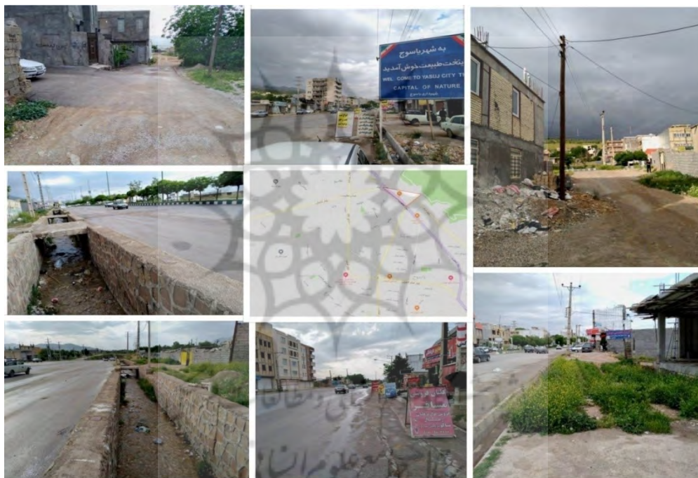
شکل ۳. نمایی از وضعیت فضای عمومی محلهٔ بنسنگان

عمومی آن، آلودگی صوتی و زیست‌محیطی تحت تأثیر وجود و تعدد تعمیرگاه‌ها در فضای محله و مکان‌یابی نامناسب آن‌ها که ضمن اشغال فضا موجب ایجاد فضایی نازیبا در محله شده (شکل ۳)، عدم توجه شهرداری به خواسته‌های ساکنان و نبود هیچگونه نشست باز در زمینه رفع مشکلات موجود و شکل‌گیری دیدگاه منفی مردم در مورد شهرداری و شورای شهر و سایر مشکلات در گذر زمان بر ساختار محلهٔ بنسنگان و فضاهای عمومی آن تأثیرگذار بوده است. مجموع مسائل ذکر شده باعث شده است فضاهای عمومی این محله از استانداردهای یک فضاهای عمومی سرزنده، پرجنب‌وجوش و دارای ارتباطات اجتماعی قوی و زندگی جمعی محروم باشد، که نتیجهٔ آن کمبود سرزندگی، امنیت و آسایش روانی در محله است. نمایی از وضعیت کالبدی محله بنسنگان در شکل ۳ مشاهده می‌شود.