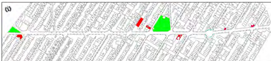
تصویر شماره (۴). موقعیت فضای سبز، محل نشستن و ابنیه تجاری فعال تا پایان شب.