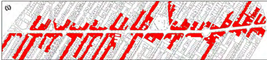
تصویر شماره (۳). موقعیت بدنه تجاری در خیابان اصلی رجایی شهر.