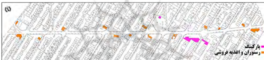
تصویر شماره (۵). موقعیت پارکینگ‌های خودرو، رستوران و اغذیه‌فروشی.