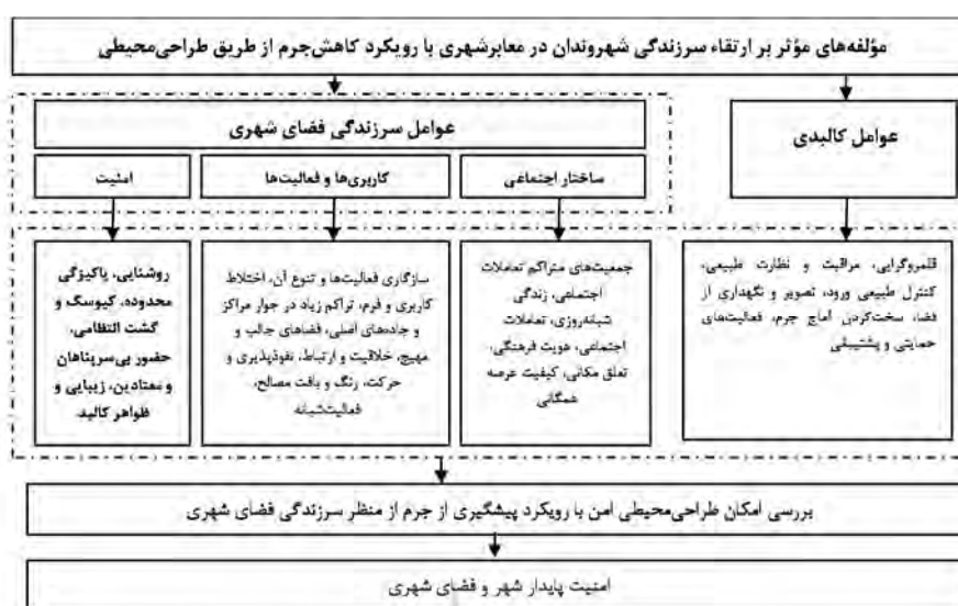
نمودار شماره (۱). مدل مفهومی پژوهش؛ منبع: نگارندگان، ۱۴۰۱.