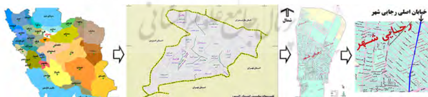
تصویر شماره (۱). ترتیب قرارگیری موقعیت محدوده مورد مطالعه.

در این پژوهش خیابان اصلی رجایی شهر کرج به دلیل پیاده‌مدار بودن با طول مسیر پیاده (۱۸۰۰) متر و محله با مساحتی در حدود (۱۹۰) هکتار انتخاب شد (تصاویر شماره ۱ و ۲). محور پیاده در هر طرف معبر (خیابان اصلی) در بخش‌های مختلف، عرضی با میانگین بین (۲ تا ۴) متر را دارد. حضور افراد برای خرید، بیشتر در زمان عصر شروع می‌شود. این حضور در روزهای پایانی هفته و روزهای تعطیل به ویژه ایام پایانی سال به اوج خود می‌رسد عمده نقش حمل و نقل عمومی در این محدوده به عهده خطوط تاکسی و اتوبوس است.