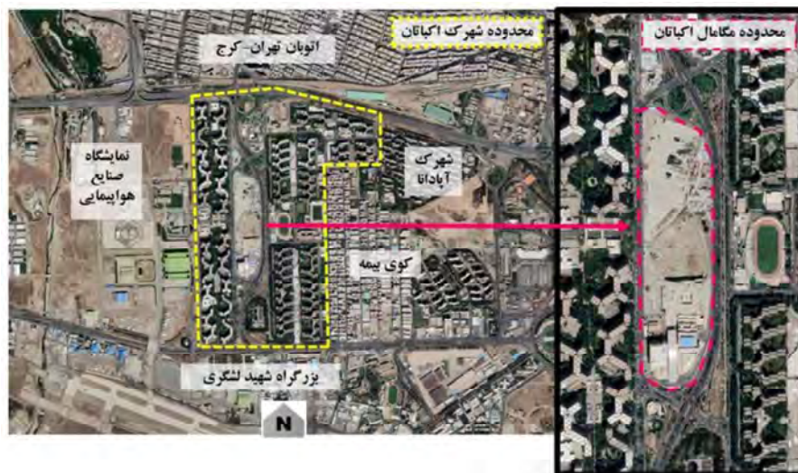
شکل شماره ۲. مگامال اکباتان واقع در شهرک اکباتان