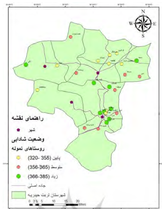
تصویر ۳. نقشه وضعیت شادابی منطقه مورد مطالعه.