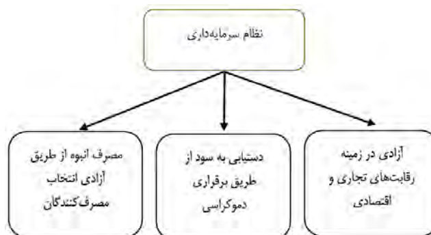
شکل ۱. ویژگی نظام سرمایه‌داری

تضمین‌کننده سرمایه‌داری جمعی ایده‌آل ۱ است و وظیفه دارد که به تأمین زیرساخت‌ها و شرایط عمومی تولید، ایجاد و اجرای نظم حقوقی بورژوازی، رفع تعارضات میان سرمایه و دستمزد و ارتقای سرمایه ملی در بازار جهانی سرمایه بپردازد (Jessop, 1982:90-91) دولت‌ها در این فرآیند به کوچک کردن بازوهای قدرت، واگذاری یا کاهش وظایف نظارتی دولت مرکزی یا انتقال آن به سطوح پایین‌تر، بازسازی فضاهای سیاسی در ارتباط با نظام سرمایه‌داری می‌پردازند (Brenner, 2004). با در نظر گرفتن نقش دولت در تسهیل عملکرد فضایی سرمایه، ویژگی‌های نظام سرمایه‌داری را می‌توان به صورت زیر به نمایش گذاشت.