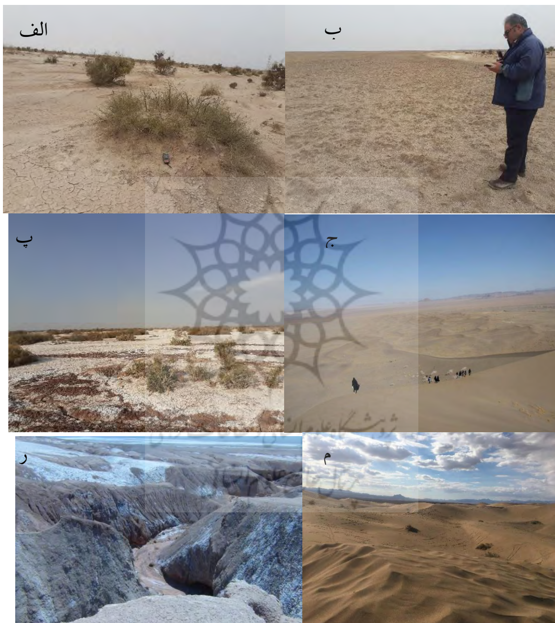
شکل ۳- تصاویری از عوارض تعدادی از کویرهای استان یزد. الف) تصویری از نیکازارهای کویر ابرکوه، ب) تصویر کویر شخم زده و پف کرده ابرکوه، پ) تصویری از درختان واقع در کف چاله کویری ابرکوه با درختزارهای رشد یافته در دل این نمکزار، ج) تصویری از تپه‌های ماسه‌ای حاشیه کویر زرین، ر) تصویر کلوت‌های حاشیه کویر سیاه کوه اردکان و م) تصویری از تپه‌های ماسه‌ای حاشیه کویر بافق