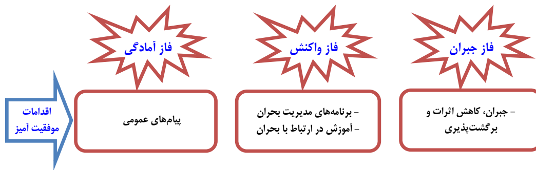
شکل ۱- مراحل و اقدامات ارتباطات در بحران.

نمایند و سپس اطلاعات مورد نیاز را برای آنها تهیه و از کانال- های مختلف به کشاورزان منتقل نمایند.