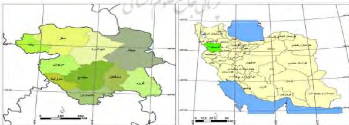
شکل ۲: موقعیت استان کردستان و شهرستان‌های آن

استان کردستان دارای ۸ شهرستان، ۱۲ شهر، ۲۱ بخش، ۷۸ دهستان و ۱۷۶۵ آبادی دارای سکنه است. شهرستان‌های این استان عبارت‌اند از: بانه، بیجار، دیواندره، سقز، سنندج، قروه، کامیاران و میوان. در حال حاضر استان کردستان با مجموعه شهرها، روستاها و عشایری که در اقصی نقاط آن پراکنده شده و استقرار یافته‌اند، به یکی از نواحی در حال توسعه غرب کشور تبدیل شده و از پتانسیل‌های توریستی و تفرجگاهی بسیار خوبی برخوردار است. این استان منطقه‌ای کوهستانی است که از میوان تا دره قزل‌اوزن و کوه‌های زنجان جنوبی در مشرق گسترده شده است. ناهمواری‌های این استان که تحت عنوان ناحیه کوهستانی کردستان مرکزی برسی می‌شود، مشتمل بر دو بخش غربی و شرقی است؛ این دو قسمت از نظر شکل پستی‌وبلندی و جنس زمین متفاوت‌اند. قسمت وسیعی از سنندج، میوان و سرزمین‌های اطراف آن‌ها تا جنوب کردستان بخش کوهستانی غربی را تشکیل می‌دهد. در این ناحیه، یکنواختی و سستی جنس زمین اشکال مشابهی را به وجود آورده که از ویژگی‌های آن کوه‌های گنبدی شکل با شیب یکنواخت و ملایم همراه با دره‌های باز است این یکنواختی را طبقات آهکی سخت و سنگ‌های درونی که بین لایه‌های سست ظاهر می‌شوند، درهم‌ریخته و آن را به صورت صخره‌های عریان درآورده است. در این ناحیه شعبه‌های رود قزل‌اوزن در شرق و شمال شرقی و رود سیروان در جنوب چهره زمین را به‌طور کامل تغییر داده‌اند.