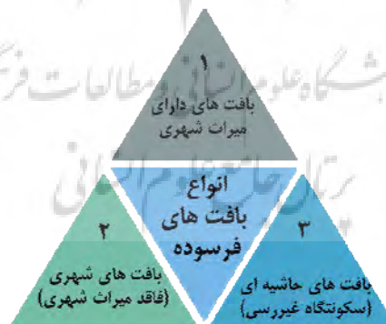
شکل ۲. انواع بافت‌های فرسوده

ج. بافت‌های حاشیه‌ای (سکونتگاه‌های غیررسمی) . مراد از بافت‌های حاشیه‌ای، بافت‌های فرسوده‌ای است که به علت نبود تناسب میان درآمد متقاضیان سکونت در شهرهای بزرگ و هزینه‌های سکونت در آن‌ها، بیشتر به طور غیر رسمی در حاشیه شهرها شکل گرفته‌اند. ساکنان این بافت‌ها، بیشتر مهاجران جویای کار هستند که در شهرهایی ساکن شده‌اند که توانمندی‌های زیاد در عرصه‌های اشتغال و خدمات دارند (مهندسین مشاور شاران، ۱۳۸۴، ص. ۹).