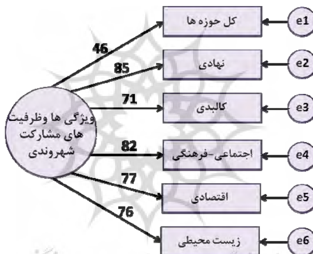
شکل ۳. شناسایی ظرفیت‌های مشارکت شهروندی

در این بخش، ظرفیت‌های مشارکت شهروندی برای برنامه‌ریزی مشارکتی در شهرک شهید باهنر کلان‌شهر مشهد، با استفاده از تحلیل عاملی مرتبه دوم شناسایی شده و وضعیت وجود این ظرفیت‌ها در شهرک شهید باهنر بررسی شده است. طبق نتایج پژوهش، ظرفیت‌های مشارکت شهروندی شامل کل حوزه‌ها، نهادی، کالبدی، اجتماعی-فرهنگی، اقتصادی و زیست‌محیطی است و همچنین ظرفیت مشارکت شهروندی برای بازآفرینی بافت ناکارآمد شهرک شهید باهنر کلان‌شهر مشهد از نظر زیست‌محیطی در وضعیت پایین قرار دارد.