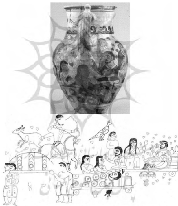
تصویر ۳. سفالینه نقاشی شده، روایت منتسب به سیاوش

یکی دیگر از گونه‌های تصویری مشابه با این نقاشی به لحاظ فرمی و معنایی، سفالینه‌ای نقاشی شده مکشوف در مرو است (تصویر ۳). این گلدان، چهار مرحله از زندگی و مرگ فردی - احتمالاً سیاوش - را روایت می‌کند. صحنه اول، سواری بر اسب سیاه در حال شکار را نمایش می‌دهد که وجود اسب سیاه، فرضیه انتساب آن به سیاوش را تقویت می‌کند. صحنه بعدی، سوگواری برای این شاهزاده است که مشابه دیوارنگاره پنجکنت (تصویر ۲)، متوفی روی تختی تصویر شده و دو زن بر بالینش مویه می‌کنند. پرده سوم تشییع جنازه و انتقال جسد و روایت آخر همنشینی او با شاهبانو یا مغبانو را نشان می‌دهد که مفهوم رستاخیز و زیستن در دنیای پس از مرگ را دربردارد. نکته قابل توجه، تصویر موج‌های آب روی گردنه کوزه است که - همان‌گونه که اشاره شد - بی‌ارتباط با ایزد باران‌آوری در هیئت سیاوش به نظر نمی‌رسد.