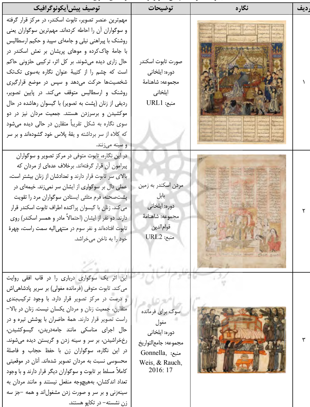
جدول ۱. توصیف پیش‌آیکنوگرافیک نمونه‌های آماری