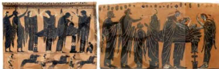
تصویر ۱. زنان سوگوار در یونان باستان؛ نقاشی‌های سپاهگون متعلق به قرن ششم ق. م.

از تراشیدن مو امتناع می‌کردند، به‌عنوان جریمه باید خود را در اختیار مردان بیگانه می‌گذاشتند و از عفت خود چشم‌پوشی می‌کردند. زنان مؤمن همچنین هنگام برداشت محصول، زمانی که غلات به‌وسیلهٔ داس درو یا زیر سم ستوران خرمن‌کوبی می‌شد، به‌جهت ابراز همدردی با خدای نباتی می‌گریستند (Alexiou, 1974: 55-58). آدونیس ۱ یونانیان نیز مانند همتای بین‌النهرینی خود در برهه‌ای از سال می‌میرد و معشوقش آفرودیت ۲ -الههٔ بارورسازندهٔ کشتزارها- برای او سوگواری می‌کند (Grant & Hazel, 2002: 10-11). این اندیشه در مراسم سوگواری یونان باستان متبلور شده و در اسناد موجود، همواره زنان در رأس مراسم سوگ گزارش شده‌اند، درحالی‌که گیسوان خود را روی شانه‌هایشان نهاده‌اند و در وصف متوفی نوحه‌های پرشور می‌خوانند (Alexiou, 1974: 12-18) (تصویر ۱).