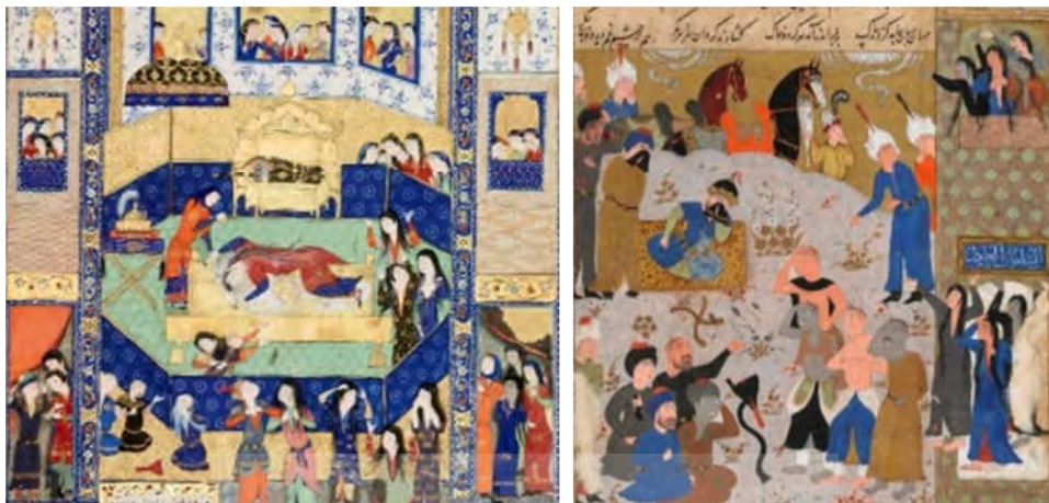
تصویر ۸. بازنمایی نقش زنان در سوگواری در نگاره‌ها؛ راست: بخشی از نگاره فوت شاهزاده و تعزیت گرفتن صاحبقرانی؛ چپ: بخشی از نگاره سوگواری برای شیرین