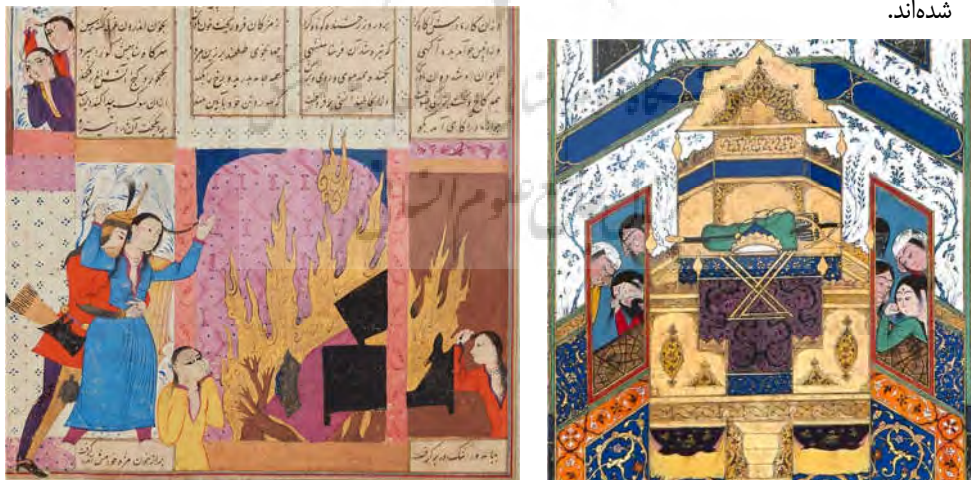
تصویر ۵. بازنمایی نقش زنان در سوگواری در نگاره‌ها؛ راست: بخشی از نگاره سوگواری برای ایرج؛ چپ:

مضمون سوگواری و حضور برجسته زنان سوگوار در نگارگری ایرانی نیز به خوبی بازنمایی شده است؛ برای مثال در نگاره سوگواری برای ایرج (تصویر ۵، راست)، ایرج، شاهزاده جوانی که نوع مرگش بی‌شبهت به مرگ سیاوش نیست، جایگزین ایزد شهیدشونده و عنصر اصلی روایت تلقی می‌شود. هرچند به جهت وفاداری به داستان، تنها سر بریده ایرج روی پاهای فریدون قرار گرفته، اما تاج شاهی و شمشیر، به نمایندگی از وی بر اورنگ نقش بسته و به لحاظ فرمی، کجاوه سیاوش در تصاویر ۲ و ۳ را یادآوری می‌کند. نزدیک‌ترین سوگواران به ایرج، زنانی هستند که درست مانند الگوهای تصویری مذکور، اطراف متوفی در حال گیسوکندن و رخ‌خراشیدن حاضر شده‌اند.