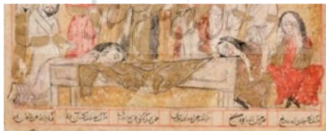
تصویر ۶. بازنمایی نقش زنان در سوگواری در نگاره‌ها؛ راست: بخشی از سوگ برای اسکندر؛ چپ: بخشی از صورت تابوت اسکندر؛ پایین: بخشی از مردن اسکندر به زمین بابل