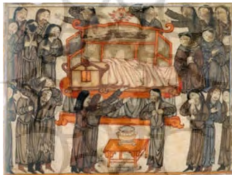
تصویر ۷. بازنمایی نقش زنان در سوگواری در نگاره‌ها، بخشی از نگاره سوگ برای یک فرمانده مغول

در دسته‌ای دیگر از نگاره‌ها، ایزد باروری از هیئت شخصیت‌هایی مانند سیاوش، ایرج، اسکندر و طلحند خارج می‌شود و در کالبد پادشاهان و شاهزادگان تجسد می‌یابد. در حقیقت در یک استحاله کلی، ایزد اسطوره‌ای به قهرمان باستانی (در قالب حماسی-روایی) و سپس به شخصیت انسانی والایی (در قالب تاریخی-انسانی)، مثلاً پادشاه، بدل می‌شود؛ برای مثال نگاره‌ای از آیین سوگ یک فرمانده مغولی (تصویر ۷) که از نظر فرم قرارگیری تابوت، جمعیت سوگوار و آرایش زنان (دو زن سوگوار بالای سر متوفی)، کاملاً با تصاویر اساطیری و حماسی مطابقت دارد.