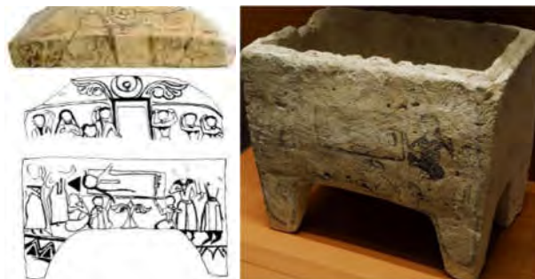
تصویر ۴. استودان‌های مرمر گچی نقاشی شده

به آیین‌های تدفین زرتشتی است (Frumkin, 1970: 101-102).