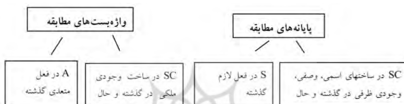
شکل (۳). بازنمایی نظام مطابقه کنائی در ساخت‌های ربطی گورانی

هرچند نظام انطباق در افعال واژگانی گسسته است، این گسستگی در ساخت‌های ربطی هیچ‌گونه بازتابی نداشته است. به این تعبیر که CS در ساخت‌های ربطی، چه در زمان حال و چه در زمان گذشته، مانند S رفتار می‌کند و تنها از پایانه‌های مطابقه بهره می‌گیرد؛ چون این سه ساخت لازم تلقی می‌شوند. اما CS در ساخت وجودی ملکی که یک ساخت متعدی تلقی می‌شود، در زمان حال و گذشته مانند A عمل می‌کند و از واژه‌بست‌های مطابقه که کنائی‌نما هستند بهره می‌برد.