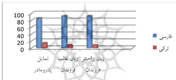
نمودار (۲). درصد گرایش به زبان ترکی و فارسی

۵۸٪ والدین به برنامه‌های آذری‌زبان رادیو و تلویزیون بسیار علاقه‌مند هستند و تنها ۲٪ والدین هیچ علاقه‌ای به این برنامه‌ها ندارند. با وجود این، با توجه به نمودار (۲)، ۸۶٪ والدین تمایل دارند که فرزندانشان به زبان فارسی صحبت کنند. علاوه بر این، ۹۲٪ دانش‌آموزان ادعا می‌کنند که غالباً از زبان فارسی استفاده می‌کنند و همین تعداد نیز اظهار کرده‌اند که با زبان فارسی مأنوس‌تر هستند. این آمار نشان می‌دهد که نگرش زبانی ۱ والدین بر تمایلات و رفتار زبانی فرزندان تأثیر بسزایی دارد.