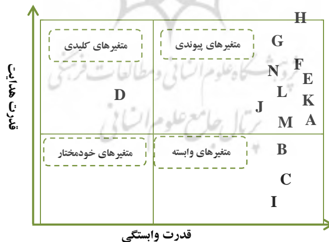
شکل ۲: ماتریس قدرت هدایت-وابستگی مخاطرات منابع انسانی در بخش سلامت

مدل تعاملی و ترسیم ارتباطات ساختاری و سلسله‌مراتبی مخاطرات حوزه منابع انسانی در بخش سلامت انجام شد. در این راستا پس از بررسی مرور نظام‌یافته و شناسایی مخاطرات منابع انسانی (جدول دو) از روش مدل‌سازی ساختاری-