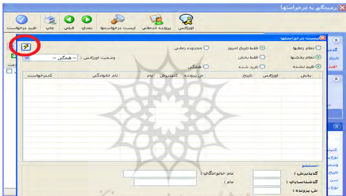
شکل شماره ۳: نمونه ای از مشکلات مربوط نقض مولفه راهنمایی و مستند سازی

از جمله مشکلات مولفه جنبه های زیبایی شناسی و طراحی حداقل ( Aesthetic ) می توان به این مورد اشاره کرد که در قسمتی از سیستم که اطلاعات مربوط به حوادث ثبت می شود، کاربر می تواند نوع حادثه را از لیست از پیش تعیین شده ای انتخاب کند که در این لیست گزینه سایر در بین بقیه موارد نوع حادثه آورده شده است؛ در حالی که معمولاً این گزینه باید به عنوان آخرین گزینه باشد (شکل شماره دو). به این مشکل شدت یک تعلق گرفت.