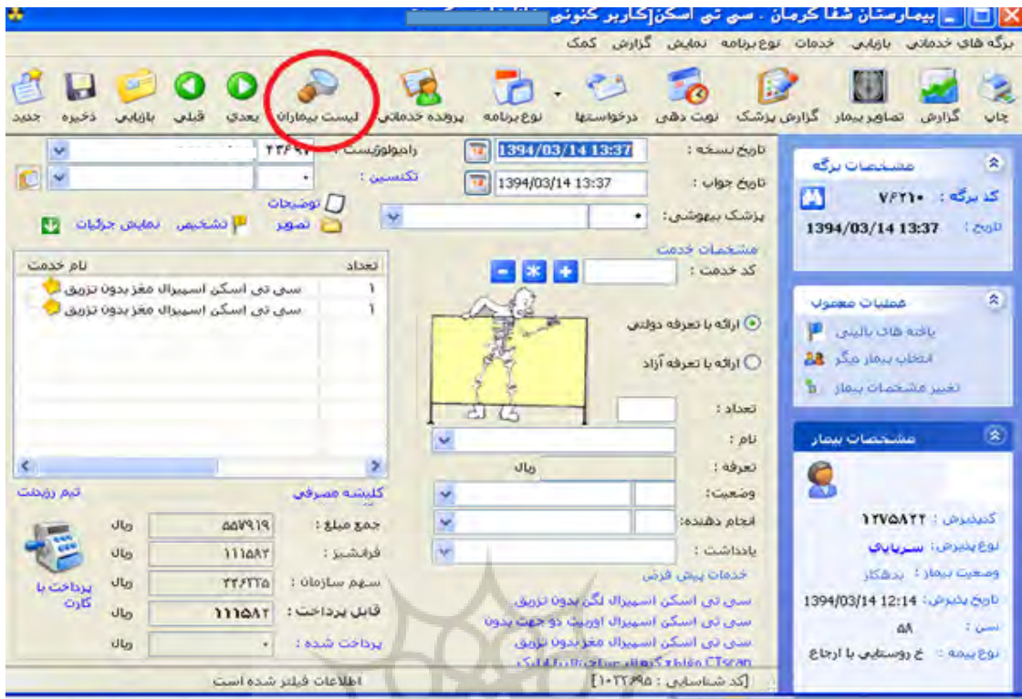
شکل ۱: نمونه ای از مشکلات مربوط به نقض اصل تطابق سیستم با دنیای واقعی

کافی برای مطلع ساختن کاربران از نوع خطا و شیوه رفع آن وجود نداشت. امکان باز کردن آیتم نوبت دهی نیز که جزو گزینه های پر کاربرد است، در صفحه اصلی وجود نداشت. از جمله مشکلات مربوط به انعطاف پذیری امکان سفارشی ساختن قسمت های مختلف برنامه (تغییر رنگ، فونت، سایز، زبان و...) است که این امکان نیز در نرم افزار برای کاربران تعریف نشده بود. در برخی از قسمت ها نیاز به بزرگنمایی اطلاعات وجود داشت که این امکان نیز در سیستم تعبیه نشده بود.