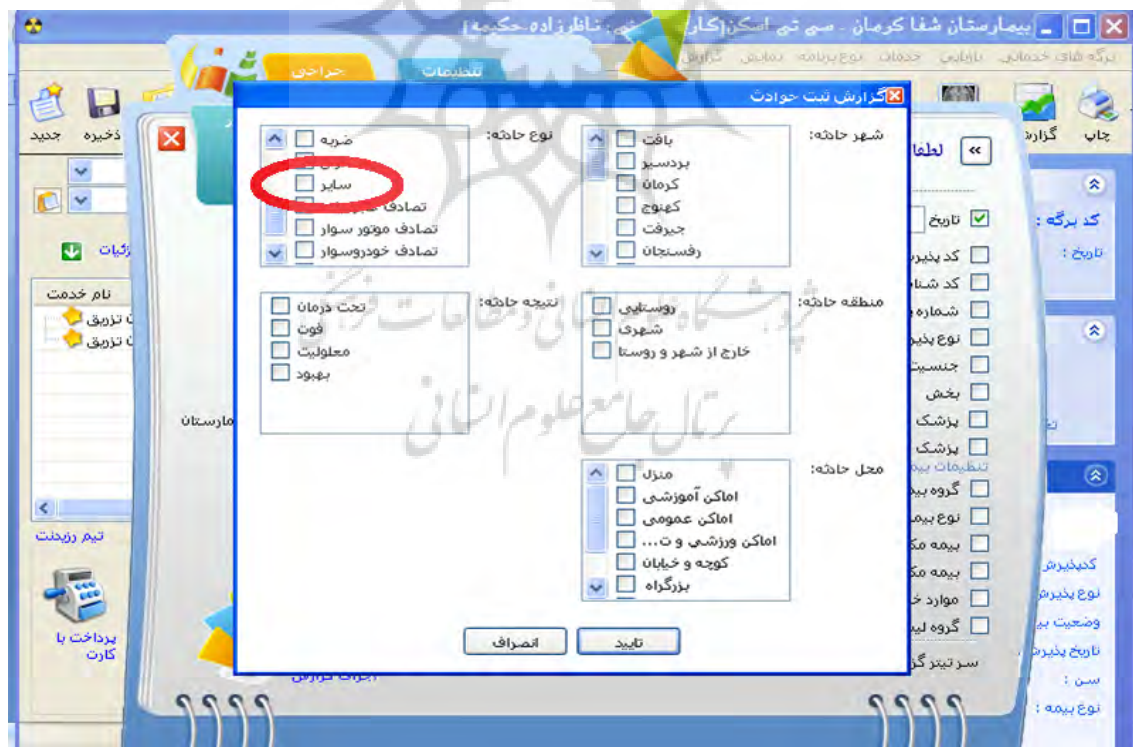
شکل ۲: نمونه ای از مشکلات مربوط به نقض اصل جنبه های زیبایی شناسی و طراحی حداقل

control ) به شمار می آید. به عنوان مثال، اگر کاربر به اشتباه وارد صفحه‌ای از سیستم شد، بتواند به راحتی از آن خارج شود. یکی از موارد این مشکل، در سیستم مورد ارزیابی قرار گرفته، مربوط به تقویم است که بعد از باز شدن آن راهی برای خروج وجود ندارد، مگر اینکه حتماً تاریخی انتخاب شود. به این مشکل شدت چهار تعلق گرفت. در برخی از پنجره‌ها نیز امکان برگشت به عقب وجود نداشت. مشکلات مربوط به مولفه پیغام خطای مناسب ( Good error message ) در سیستم نسبت به سایر مولفه‌ها کم تر به نظر می رسد؛ به عنوان مثال، هنگام استفاده از فیلد نوبت دهی پیغامی با عنوان «شما مجاز به استفاده از این قابلیت سیستم نمی‌باشید» نمایش داده می‌شود و به روشنی بیان نمی‌کند که دقیقاً چه کسانی و در چه شرایطی امکان استفاده از این قابلیت سیستم را دارند. به این مشکل درجه شدت سه تعلق گرفت.