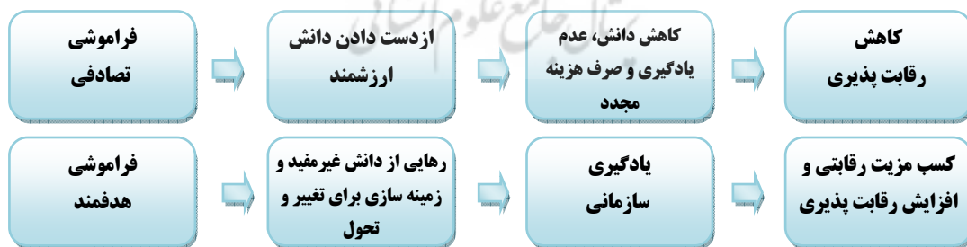
شکل ۱: رابطه نوع فراموشی با رقابت پذیری

۴- پرهیز از عادات بد (Avoiding bad habits): توانایی سازمان در اجتناب از عادات، دستورالعمل‌ها، فرایندها، عقاید و ارزش‌های