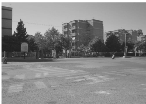
ت.۷. موقعیت مجتمع چهارصد دستگاه در بلوار حکیم