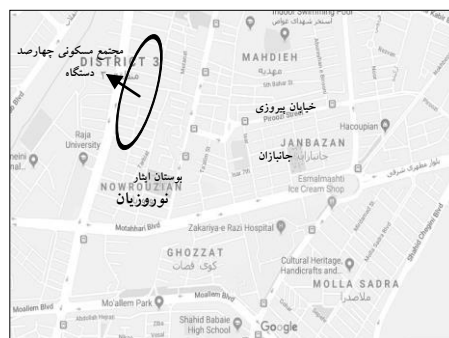
ت.۶. خیابان جانبازان در منطقه سه شهر قزوین