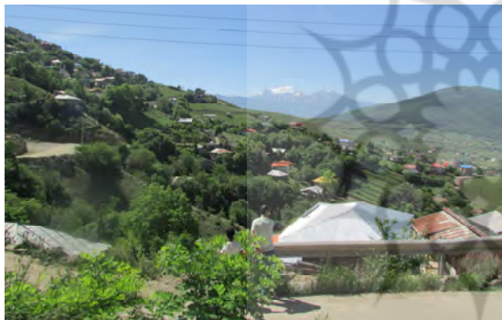
ت 3. بافت روستای کوهپیر.

روستای کوهپیر در بخش کلاردشت، شهرستان چالوس و در مسیر جاده بین روستای کردیچال - شکر کوه واقع شده است (تصویر شماره 3). این روستا به لحاظ موقعیت در طول جغرافیایی 51 درجه و 23 دقیقه شرقی و در عرض جغرافیایی 36 درجه و 40 دقیقه شمالی قرار گرفته است و ارتفاع آن از سطح دریا برابر با 1400 متر می‌باشد. فاصله روستا از مرکز شهرستان چالوس 50 کیلومتر و از مرکز دهستان کردیچال 2 کیلومتر می‌باشد. این روستا از شمال به روستای کلمه، از جنوب به روستای کردیچال، از غرب به کوه‌ها و اراضی ملی و از شرق به روستای شکرکوه محدود می‌گردد (بنیاد مسکن انقلاب اسلامی استان مازندران، 1384).