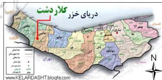
ت 2. موقعیت کلاردشت در نقشه.

کلاردشت در استان مازندران قرار دارد و از توابع شهرستان چالوس می‌باشد (تصویر شماره 2) که از جنوب به قله تخت سلیمان تا حدود گردنه کندوان و از شمال به دریای خزر و شهر تنکابن و از شرق به چالوس، نوشهر و کجور و از غرب به قزوین و الموت محدود است و در ارتفاع 1250 متری و در فاصله 191 متری از شهر تهران قرار گرفته است (رهنمایی و همکاران، 1386: 21).