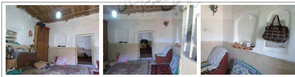
ت 4. تاقچه‌های دیواری کاربردی در یک اتاق چند عملکردی.

فضای بسته: فضاهای بسته در این منطقه شامل فضای نگهداری دام، فضای خدماتی و فضای زندگی (فضای عمومی و خصوصی) می‌باشد. فضای خصوصی فضایی است که پخت و پز در آن صورت می‌گیرد و اعضای خانواده در آنجا روز خود را سپری می‌کنند و محل زندگی، غذا خوردن و خواب آن‌ها است و با توجه به اینکه به دلیل شرایط مالی روستاییان امکان اتاق اختصاصی برای هر یک از اعضای خانواده امکان‌پذیر نیست طراحی داخل اتاق‌ها به گونه‌ای است که با قرار دادن تاقچه‌های متعدد برای لوازم کاربردی و گنجه‌های بزرگ درون دیوار برای لباس یا رختخواب و فضاهایی از این قبیل نیازهای آن‌ها را برطرف می‌کند و فضای عمومی فضایی است که کمتر مورد استفاده قرار می‌گیرد و از آن برای پذیرایی از مهمان که ورودی جداگانه‌ای دارد استفاده می‌شود (تصویر شماره 4).