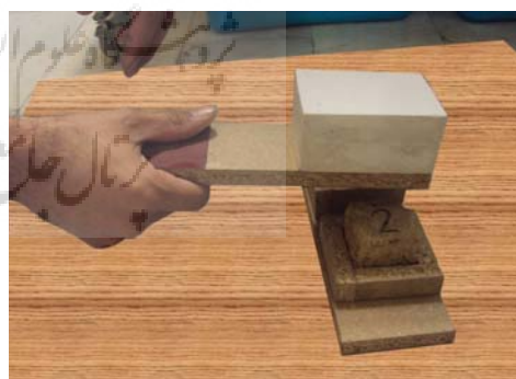
ت ۲. آزمون مقاومت سایشی.

برای آزمایش جذب مویینگی نمونه خشت‌ها به مدت ۲۴ ساعت در دمای ۶۰ درجه سانتی‌گراد در اون قرار داده شد تا رطوبت آن بخار شود و کاملاً خشت گردد. سپس خشت‌ها در دسیکاتور خنک شدند (به مدت نیم ساعت تا ۱ ساعت). پس از آن کف یک سینی یک تکه ابر به ضخامت ۱ سانتی‌متر و پارچه‌ای نخی روی آن قرار داده شد و به اندازه ضخامت ابر به سینی آب مقطر اضافه شد خشت‌ها به فاصله زمانی ۱۰ ثانیه پشت سر هم داخل سینی روی ابر قرار گرفته و به فاصله‌های زمانی معین شده برای این آزمایش، ارتفاع آب بالا آمده در خشت‌ها اندازه گرفته شد (تصویر شماره ۳). لازم است که هر چند دقیقه دوباره به سینی آب مقطر اضافه گردد تا آب جذب شده در نمونه‌ها جبران شود. این کار تا زمان بالا آمدن آب در چهار وجه خشت و اشباع کامل ادامه یافت و زمان نهایی ثبت گردید. پس از این آزمون و پس از اشباع کامل نمونه‌های خشت، روی آن‌ها آزمون مقاومت فشاری انجام پذیرفت تا مقاومت در مقابل فشار نمونه‌های خیس نیز اندازه گیری گردد.