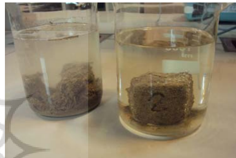
ت ۴. آزمایش غوطه‌وری (نمونه شماره ۱ و ۲).

۸۰۰ میلی‌لیتر آب مقطر اضافه شد و سپس نمونه خست‌ها به بشرها منتقل شدند. در فاصله‌های زمانی یکسان میزان تخریب نمونه‌ها به صورت کیفی بررسی شده و نتایج به صورتی که در این جدول دیده می‌شود، ثبت گردید. یکسان بودن شرایط برای همه نمونه‌ها شرط اصلی صحت این آزمون است، لذا انتخاب ظرف، حجم آن و سایر ویژگی‌ها بر عهده پژوهشگر می‌باشد اما بهتر آن است که در این آزمون نمونه کاملاً در آب غرق شده باشد و میزان این آب برای همه نمونه‌ها مساوی باشد (تصویر شماره ۴).