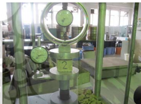
ت ۱. آزمایش مقاومت فشاری به وسیله دستگاه تک محور.

صاف یک تخته چوبی چسبانده شده است، ۹۰ بار در یک جهت روی نمونه مکعبی کشیده شدند و پس از اتمام آزمایش دوباره نمونه‌ها به مدت ۲۴ ساعت در دمای ۶۰ درجه سانتی‌متر خشک شده و دوباره وزن شدند (M2). اختلاف وزن اول و دوم نمونه (M1- M2) میزان فرسایش وزنی آن را نشان می‌دهد. در این آزمایش به تعداد نمونه‌ها، تکه سنباده‌های یک اندازه و با درجه زبری یکسان تهیه گردید و برای هر نمونه فقط یک تکه از سنباده استفاده شد. قالبی گچی به وزن ۳۰۰ گرم نیز روی تخته‌های چوبی نصب شد تا از نیروی دست برای وارد کردن فشار عمودی استفاده نشود و میزان نیرو با حداقل خطا در طول آزمون ثابت باشد (تصویر شماره ۲).