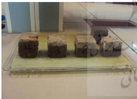
ت ۳. آزمون مویینگی.

برای آزمایش جذب مویینگی نمونه خشت‌ها به مدت ۲۴ ساعت در دمای ۶۰ درجه سانتی‌گراد در اون قرار داده شد تا رطوبت آن بخار شود و کاملاً خشت گردد. سپس خشت‌ها در دسیکاتور خنک شدند (به مدت نیم ساعت تا ۱ ساعت). پس از آن کف یک سینی یک تکه ابر به ضخامت ۱ سانتی‌متر و پارچه‌ای نخی روی آن قرار داده شد و به اندازه ضخامت ابر به سینی آب مقطر اضافه شد خشت‌ها به فاصله زمانی ۱۰ ثانیه پشت سر هم داخل سینی روی ابر قرار گرفته و به فاصله‌های زمانی معین شده برای این آزمایش، ارتفاع آب بالا آمده در خشت‌ها اندازه گرفته شد (تصویر شماره ۳). لازم است که هر چند دقیقه دوباره به سینی آب مقطر اضافه گردد تا آب جذب شده در نمونه‌ها جبران شود. این کار تا زمان بالا آمدن آب در چهار وجه خشت و اشباع کامل ادامه یافت و زمان نهایی ثبت گردید. پس از این آزمون و پس از اشباع کامل نمونه‌های خشت، روی آن‌ها آزمون مقاومت فشاری انجام پذیرفت تا مقاومت در مقابل فشار نمونه‌های خیس نیز اندازه گیری گردد.