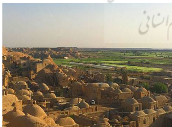
ت 3. نمایی از روستای قلعه‌نو.