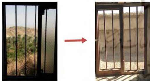
کیفیت منظر روستای نایبند قدیم

واحدهای همسایگی در طراحی روستای جدید به عنوان دلایل عدم استقبال روستاییان در حوزه کیفیت طراحی در روستای جدید مورد بررسی قرار گرفته است که در این مقاله به بررسی تأثیر کیفیت دید و منظر در بازسازی روستای نایبند و استقبال روستاییان از روستای جدید پرداخته شده است. این مقاله در روستای نایبند به بررسی سه بعد منظر زیستی، منظر اجتماعی و منظر کالبدی معنا به عنوان لایه‌های شکل‌دهنده منظر روستا، پرداخته است. نتایج این پژوهش حاکی از آن است که لحاظ نمودن مؤلفه منظر در ارتقای کیفیت فضایی سکونتگاه‌های روستایی جدید، تأثیرگذار است و در نظر گرفتن مؤلفه منظر با استقبال روستاییان از سکونتگاه جدید ارتباط مستقیم دارد. مهمترین دلایل عدم استقبال روستاییان از روستای جدید نایبند از دیدگاه روستاییان، حس تعلق به روستای قدیم، در نظر نداشتن ملاحظات اقلیمی در طراحی روستای جدید و کیفیت نامطلوب مؤلفه دید و منظر در روستای جدید عنوان شده است که فرضیه دوم تحقیق را تأیید می‌کند.