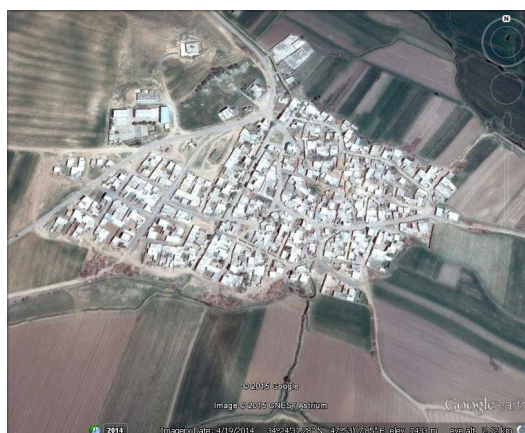
ت 4. نقشه شهرستان دهلر.