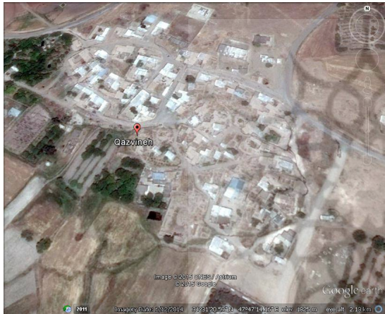
ت 2. نقشه شهرستان قزوین.