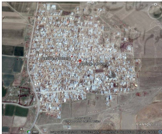
ت 3. نقشه شهرستان قارلق.

آلفای کرونیباخ برای گویه‌ها و سؤال‌های اشاره شده، محاسبه شد. میزان این ضریب که در اصل، میزان پایایی ابزار را مشخص می‌کند، برای بخش دوم و سوم و چهارم ابزار، به ترتیب 86/0، 88/0 و 85/0 به دست آمد. در کل 168 پرسشنامه کامل و بدون نقص تکمیل شد (نرخ پاسخگویی = 91 درصد). پس از تکمیل داده‌ها عملیات کدگذاری، استخراج اطلاعات و انتقال آن‌ها بر روی رایانه صورت پذیرفت. پس از طی فرایند داده‌پردازی، محاسبات آماری (توصیفی و استنباطی) با استفاده از برنامه SPSS نسخه 20 انجام شد.