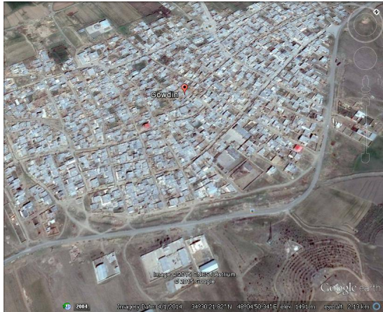
ت 1. نقشه شهرستان گودین.