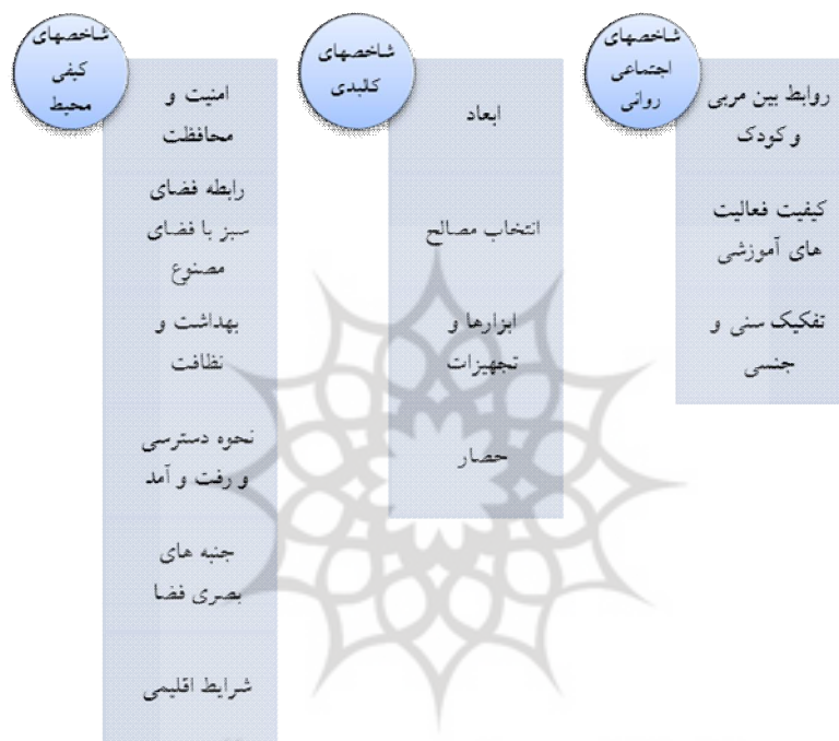
ت 1. شاخص‌های مرتبط با فضاهای دوستدار کودک در بم.

شرایط فضاهای دوستدار کودک در بم ایجاد گردد تا بدین ترتیب متغیرهای مرتبط با شاخص‌ها درباره موضوع پژوهش معنادار باشند. از آنجا که تحقیق در دست انجام به شکل کیفی صورت می‌گیرد، متغیرهای استخراج گشته کیفی می‌باشد و با اعداد و ارقام نمی‌توان ویژگی‌های آن را بیان نمود، در نتیجه قابل اندازه گیری نیست.