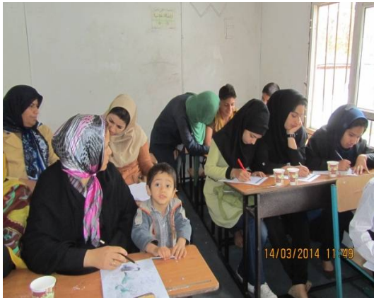
ت 2. برگزاری جلسه گروهی در کانکس به منظور جمع‌آوری اطلاعات توسط پژوهشگر.

پس از جمع‌آوری برگه پرسش‌ها، برگه سفیدی در اختیارشان گذاشته شد تا هر آنچه از فضاهای دوستدار کودک به‌خاطر دارند بر روی کاغذ بنویسند و یا به‌صورت گرافیکی بکشند. بیشترین تمرکز در این بخش از مصاحبه بر روی فعالیت‌هایی است که در فضاهای دوستدار کودک انجام شده است و میزان رضایت افراد از آن‌ها سنجیده می‌شود. پس از پایان این بخش و استراحت افراد، زمانی در اختیار همه افراد مشارکت‌کننده گذاشته شد تا اطلاعاتشان را در گروه، به‌صورت گروهی بیان کنند و فرد تسهیل‌گر این اطلاعات را یادداشت نموده تا بانظم دادن به اطلاعات آن‌ها را به‌صورت جدول در آورده و نظرات را دسته‌بندی نماید. در ادامه بحث گروهی، برگه‌ای به نام «برگه سودمندی‌ها و مشکلات» 8 در اختیار هر فرد گذاشته شد تا افراد بتوانند به تفکیک نظراتشان را بر روی این برگه بنویسند. پس از تکمیل شدن آن توسط هر فرد، برگه مذکور در اختیار سایر افراد گروه گذاشته شده تا آن‌ها بتوانند موافقت و یا مخالفت خود را با موضوع‌های مطرح شده در برگه، با گذاردن ✓ و ✗ نشان دهند.