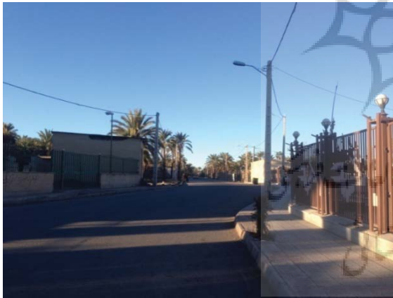
ت ۱. محله امامزاده زید.

محله امامزاده زید همراه محله سید طاهرالدین در شرق بم واقع شده است.