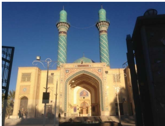
۲. بنای امامزاده زید.

حدود ۲۱۵۹ نفر بوده که بعد از وقوع زلزله به ۱۵۲۴ نفر کاهش یافته است. درصد تخریب محله نیز بالای ۸۰ درصد بوده است. در حال حاضر جمعیت محله حدود ۲۰۰۰ نفر و میزان بازسازی‌های انجام‌شده واحدهای مسکونی مطابق مطالعات میدانی حدود ۸۵ درصد است.