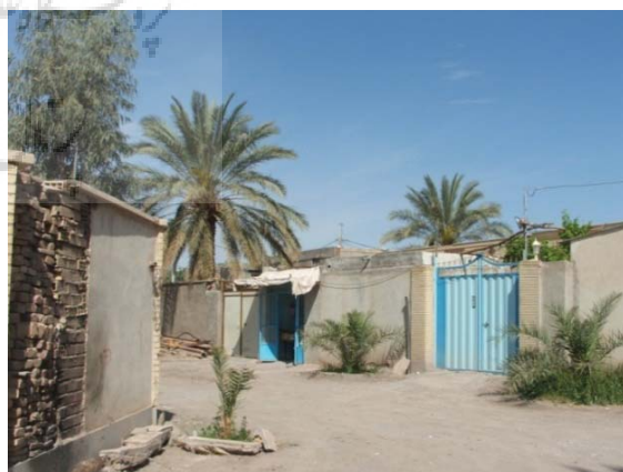
۳. محله قصر حمید.

محله قصر حمید از محلات اولیه شکل گرفته بعد از خارج شدن توسعه شهر از ارگ است که پیش از سال ۱۲۸۵ نیز وجود داشته و جایگاه سکونت اولیه خوانین بمی بعد از خروج از ارگ بوده است. قرارگیری در مرکز شهر و همجواری با بازار شهر از ویژگی‌های اصلی این محله به‌شمار می‌آید.