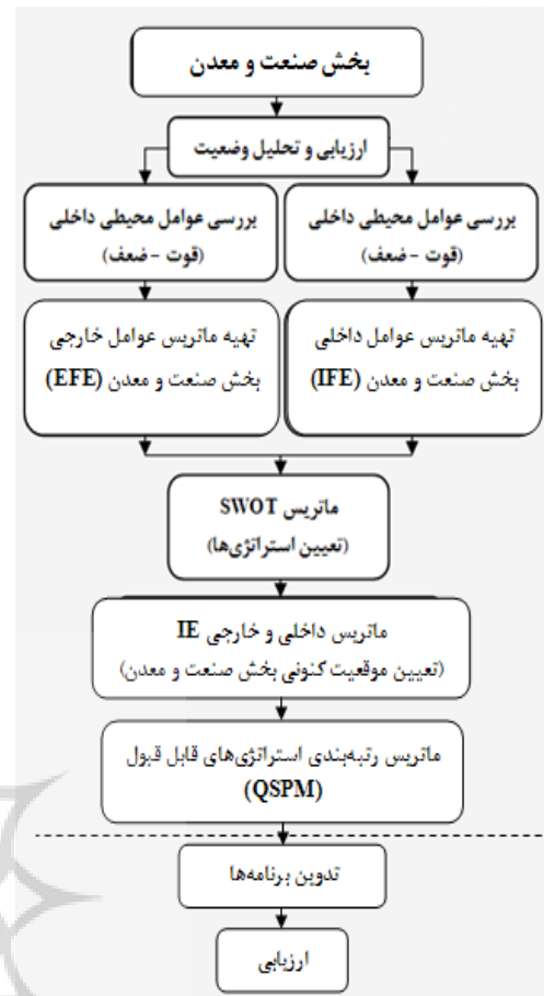
ن ۲. مدل برنامه‌ریزی استراتژیک بخش صنعت و معدن استان خراسان جنوبی.

جهت ارتقا و بهبود وضع موجود با به بیان دیگر در راستای تقویت نقش بخش صنعت و معدن (با توجه به توان بالقوه آن در استان) در توسعه منطقه خراسان جنوبی، استراتژی‌ها و راهبردهای متعددی را می‌توان به‌کار بست که براساس بررسی‌ها و محاسبات صورت گرفته در این تحقیق، راهبرد ایجاد و توسعه زیرساخت‌های مورد نیاز بخش صنعت و معدن و محیط زیست، تکمیل شبکه‌های حمل و نقل و حامل‌های انرژی و توزیع زیرساخت‌ها متناسب با تقاضای سرمایه‌گذاری، از برترین اولویت اجرا برخوردار است.