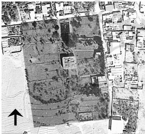
ت ۱۵. عکس هوایی باغ صدری روستای محمدآباد

در حال حاضر محدوده باغ بدون هرگونه حصار یا دیوار دور است ۱۹ ، اما حد پیرامونی آن قابل تشخیص می‌باشد. باغ به شکل مستطیل تقریباً کاملی است که در راستای شمالی جنوبی قرار گرفته است (تصویر ۱۵). باغ صدری به طول حدود ۱۸۰ متر و عرض حدود ۱۳۰ متر و مساحت حدود ۲/۳ هکتار می‌باشد. شیب زمین در راستای محور طولی باغ از سمت جنوب به شمال رو به پایین و حدود ۰/۴٪ می‌باشد. سطح باغ در لبه شمالی (همجوار کوچه) بلندتر و اختلاف ارتفاعی در حدود ۱/۵ الی ۲ متر دارد. بدین ترتیب دسترسی اصلی به باغ از ضلع شرقی (کوچه همجوار) و از محور فرعی عرضی صورت می‌گرفته است (تصویر ۱۶).