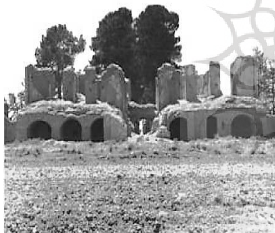
ت ۱۳. تصویری از نمای شمالی کوشک شمالی باغ تقی آباد.

عمارت مرکزی با کمی انحراف از محور طولی در میانه باغ قرار گرفته است (تصویر ۱۴). این عمارت به صورت مستطیل شکل در میانه عرصه مستطیل شکل باغ (و تقریباً در مرکز آن) عمارتی کوشک مانند قرار گرفته