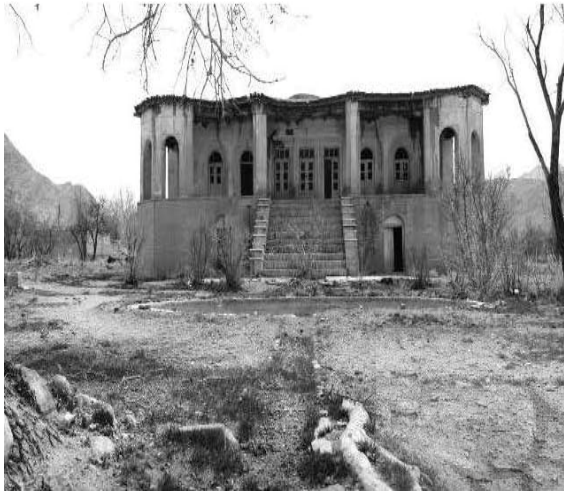
ت ۱۸. تصویری از نمای شمالی عمارت اصلی (منبع نگارنده، ۱۳۹۲).

در یک طبقه بر روی زیر زمین به سطح اشغال حدود ۴۰۰ متر مربع قرار گرفته است. زیر زمین عمارت به واسطه شیب زمین در بخش شمالی مرتفع شده و صورت طبقه همکف به خود گرفته به گونه‌ای که دسترسی به طبقه اصلی توسط پلکان نسبتاً مرتفعی میسر شده است (تصویر ۱۸).