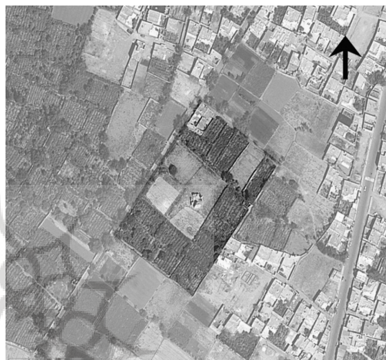
ت ۲. عکس هوایی باغ افضلیان در روستای مند گناباد.

مرکز آن) عمارتی کوشک مانند قرار گرفته است. این کوشک که با توجه به طرح و جزئیات آن احتمالاً متعلق به دوره ایلخانی یا تیموری است (گزارش ثبتی اثر)، بنایی است به شکل هشت ضلعی به سطح اشغال حدود ۱۵۰ مترمربع که به صورت دو طبقه با مصالح گل و خشت خام و گچ ساخته شده و دارای چهار ورودی می باشد.