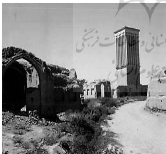
ت ۱۱. عکس از هشتی و بادگیر بر فراز آن در باغ نوری

باغ نوری در حدود ۲۰ کیلومتری جنوب کرمان در روستای اسماعیل آباد از دهستان جوپار قرار گرفته است. این باغ توسط محمد اسماعیل خان نوری ملقب به وکیل الملک از حکام دوره قاجار کرمان (در حدود سال‌های ۱۲۷۷ الی ۱۲۸۴) بنا شده است (گزارش ثبتی اثر). علی رغم تخریب بخش عمده‌ای از مستحدثات باغ، محدوده آن تا حدود زیادی قابل تشخیص است (تصویر ۱۰). این محدوده به شکل یک مستطیل ناقص به طول حدود ۱۳۰ متر و عرض حدود ۷۵ متر و مساحت حدود ۰/۸۵ هکتار می‌باشد.