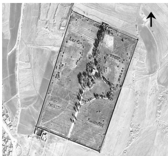
ت ۱۲. عکس هوایی باغ نشاط تقی آباد نیشابور (Google Earth 2014).