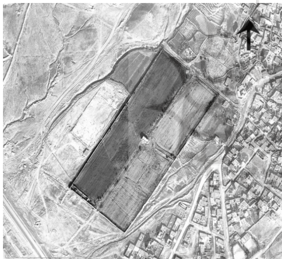
ت ۷. عکس هوایی باغ علی آباد بجنورد

همان‌گونه که در توصیف بالا اشاره شد، باغ طاباغاغی از انواع باغ‌های بزرگ مطبق کشیده (همچون باغ شاهزاده ماهان) بوده است. باغ شاهزاده ماهان باغی مطبق و مستطیل شکل به مساحت حدود ۴/۹ هکتار با شیب حدود ۵٪ با کوشک ورودی و کوشک انتهایی می‌باشد.