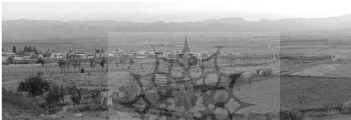
ت ۸. تصویر گسترده از باغ علی‌آباد بجنورد.

دارد. جوی آبی به عرض ۲۵ سانتیمتر و عمق ۱۰ سانتیمتر از سمت شمال باغ به درون حوض این حوض‌خانه وارد و از جنوب آن خارج می‌شود (تصویر ۹)، که طرح حوض و آبروی میانی کاخ باغ صاحب آباد تبریز را تداعی می‌کند (مسعود، ۱۳۹۰، ص ۴۹). این عمارت دارای چهار ورودی است. ورودی‌های شمالی و جنوبی کاملاً شبیه یکدیگر به حوضخانه میانی باز شده و بزرگتر از ورودی‌های شرقی و غربی می‌باشند که به اتاق‌های طرفین باز می‌شوند. اتاق‌ها رو به