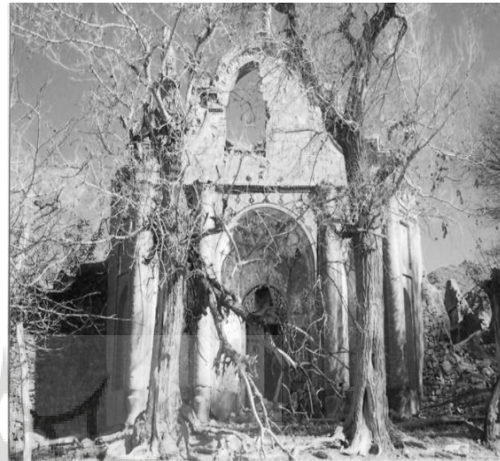
ت ۵. نمایی از سردر ورودی باغ سرهنگ آباد.

حمام شامل فضاهایی چون سربینه، گرمخانه، دالان و خزینه و حوض مرمر بوده است. همان‌گونه که اشاره شد ورودی اصلی بنا در جبهه غربی در میانه این حیاط قرار دارد (تصویر ۵).