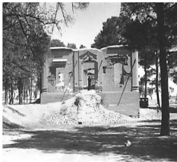
ت ۱۴. تصویری از نمای جنوبی کوشک میانی باغ تقی‌آباد.

است. باغ دارای تعداد زیادی درخت کاج در محورهای اصلی و درختان میوه (پسته) در کرت‌ها بوده است.