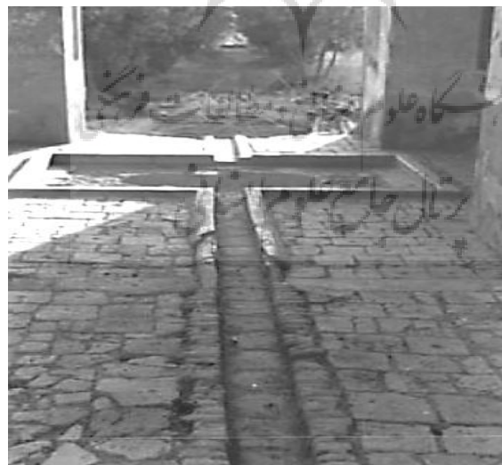
ت ۹. عکس از داخل کوشک میانی (منبع گزارش ثبتی اثر، ۱۳۸۰).