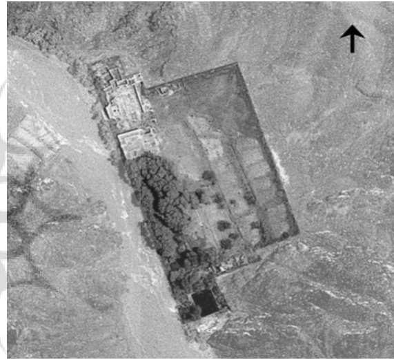
ت ۳. عکس هوایی باغ سرهنگ آباد زواره.

فضاهای متعددی همچون کوشک، عمارت بادگیر، مطبخ، آسیاب، حمام، قراول خانه، اصطبل، حیاط، برج دیده‌بانی، قنات، استخر و یخچال است. در بیرون باغ در سمت جنوب قناتی وجود دارد که به قنات سرهنگ آباد معروف است. آب این قنات به استخری در بیرون از حصار جنوبی باغ می‌ریزد. آب استخر محوطه باغ را سیراب و در ادامه به پایین دست می‌رفته است (پورصالحی، ۱۳۸۰). سپس قبل از روستای سرهنگ آباد (به فاصله حدود یک و نیم کیلومتری از باغ) انشعابی از آن به یخچالی وارد می‌شده است.