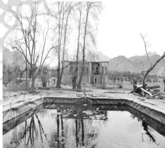
ت ۱۷. تصویری از جبهه شمالی در امتداد محور اصلی باغ (منبع نگارنده، ۱۳۹۲).

عمارت در طبقه اصلی واجد یک راهرو (رواق) پیرامونی است که به واسطه ساخت دیوارهای نیم‌بازی در گوشه‌های آن حکم ایوان‌هایی در چهار جبهه بنا پیدا کرده است. اتاق‌های متعدد به صورت مجزا به این رواق باز می‌گردند (تصویر ۱۸). با وجود اینکه عمارت فوق در یک روستا بنا شده اما از نظر جزئیات اجرایی و طرح واجد ظرایف و دقت‌های معماری است. این موضوع به‌ویژه در تزئینات ساده فضاها، درب و پنجره‌ها و پلکان و لبه‌های آن قابل مشاهده است. علی‌رغم شباهت ظاهری جهات مختلف عمارت به یکدیگر، جبهه‌های غربی و شرقی به دلیل عدم حضور پلکان دسترسی، فرعی‌تر و جبهه شمالی نیز به واسطه پلکان بلند جلوی آن و وجود دو استخر بزرگ دایره و مستطیل شکل اصلی‌ترین جبهه عمارت را تشکیل می‌دهند. ضمن آنکه در بخش جنوبی