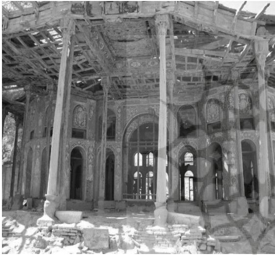
ت ۴. نمایی از ایوان رو به شرق عمارت اصلی باغ سرهنگ آباد (منبع پور صالحی، ۱۳۸۰).

بیرون باغ عمارتی بنا شده که به عمارت بادگیر معروف است که از قرار بهار نشین باغ بوده است. این عمارت شامل سه اتاق، یک تالار و یک نشیمن و دو بادگیر بوده است (که از قرار امروزه تنها یکی از آن‌ها پابرجاست). آسیابی نیز در زیر آن وجود دارد (گلبن، ۱۳۸۱). در سوی دیگر محور اشاره شده (در جبهه شمالی) عمارت دیگری بوده که احتمالاً مطبخ بوده است. راستای این دو عمارت، احتمالاً یکی از محورهای طولی باغ را شکل می‌دهد که دقیقاً در میانه محوطه باغ نبوده و نزدیک‌تر به ایوان کوشک اصلی عبور می‌کرده است.