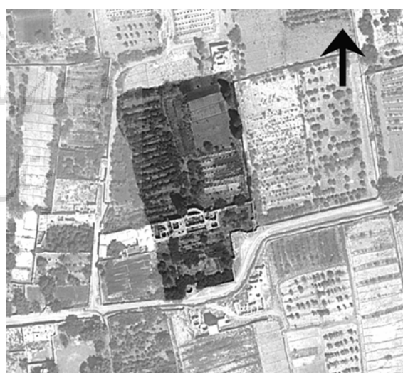
ت ۱۰. عکس هوایی باغ نوری روستای اسماعیل آباد کرمان.