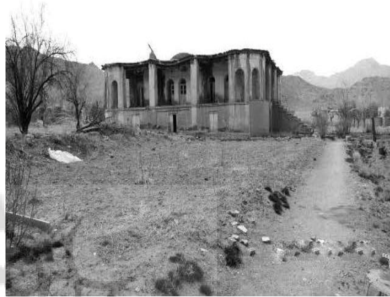
ت ۱۶. تصویری از محور فرعی ورودی باغ و نمای شرقی عمارت اصلی.

است. درختان و جوی‌های آبیاری قدیمی هنوز در باغ مشاهده می‌گردند. به‌ویژه در بخش شمالی باغ تعدادی درختان چنار بسیار کهنسال (در راستای محور اصلی) هنوز پابرجا و آثار تعدادی درختان کهنسال از میان رفته مشاهده می‌گردد (تصویر ۱۷).