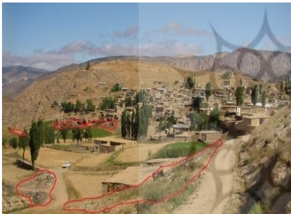
ت ۴. مکان‌های دفع زباله در روستای شاهکوه سفلی.

شیب مناسب جهت خروج مانداب‌ها می‌باشد. در این بافت با گسترش روستا پراکندگی مساکن ساخته شده نیز بسیار زیاد بوده و به‌خصوص در سمت جنوب و جنوب شرقی روستا به‌علت وجود زمین فراوان مساکن بسیار دور از هم ساخته شده و به‌همین دلیل دسترسی به کاربری‌های عمومی همانند درمانگاه، مدارس، مساجد و غیره سخت‌تر گردیده است. همچنین به‌علت عدم جمع‌آوری و دفن اصولی زباله، در اطراف روستا زباله‌های خانوارهای هر سه بافت به‌صورتی بسیار غیر اصولی و غیر بهداشتی دپو شده و بیشترین ناراضی‌تبی را برای بافت جدید ایجاد کرده است.