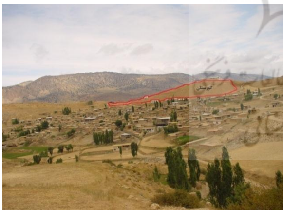
ت ۳. گورستان روستای شاهکوه سفلی.

مکانیابی کاربری‌هایی مانند فضاهای سبز محله‌ای و عمومی روستا به‌ویژه با توجه به نیاز مبرم محله‌های قدیمی به اینگونه فضاها و جلوگیری از تبدیل آن‌ها به مراکز تجمع کود، سوخت، علوفه و ... در محله‌ها ضرورت دارد (حسینی ابری، ۱۳۷۷: ۳۳) و همچنین برای گذران اوقات فراغت روستا و مسافران و بازی کودکان از کارکردهای اجتماعی فضای سبز ضرورت دارد (دربان آستانه، ۱۳۸۷: ۲۸). به‌صورت کلی بافت اولیه روستای مورد مطالعه در شیب بسیار مناسب قرار گرفته است و به این دلیل مشکل خاصی از نظر دفع فاضلاب و شکل‌گیری مانداب‌ها در کوچه‌ها وجود ندارد. از طرفی گورستان چسبیده به روستا در قسمت شرقی و مسلط بر آن مکانیابی شده است و در طول قرن‌ها به‌همین وضعیت گسترش یافته که سبب نارضایتی ساکنان شده است که البته زیباسازی گورستان فعلی نیز بسیار مهم است. احداث فضای سبز علاوه بر ابعاد روانی، در حفظ محیط زیست و زیبایی شناسی محیط نیز می‌تواند مفید باشد (مطیعی لنگرودی: ۱۳۸۳، ۱۰۴).