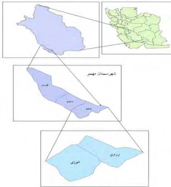
ت ۱. نقشه محدوده مورد پژوهش (بخش وراوی).