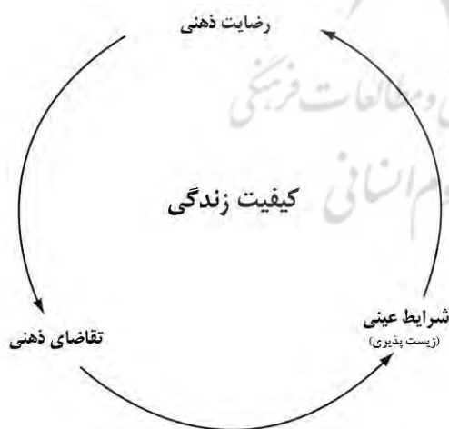
1. ارتباط زیست‌پذیری و کیفیت زندگی.

براین اساس می‌توان مدل مفهومی رابطه میان زیست‌پذیری و کیفیت زندگی را به صورت چرخه‌ای (مدور) ترسیم نمود. به طوری که انسان همواره در پی نیازها و تقاضاهای ذهنی خود، در محیط‌های بیرونی یا پیرامونی خود در جستجوی پاسخی مثبت و بهینه می‌باشد. در صورتی که شرایط موجود و عینی با کیفیت مناسب پاسخگویی نیازهای وی باشد مسلماً در پی آن رضایت ذهنی و نهایتاً کیفیت زندگی (لذت بردن از زندگی) حاصل خواهد شد. مجدداً با تأمین یکسری نیازها تقاضاهای جدیدی در ذهن شکل می‌گیرد و این چرخه همچنان ادامه می‌یابد. بدین ترتیب سکونتگاه‌های موفق و زیست‌پذیر همواره بایستی پویا و پاسخگویی نیازهای ساکنین خود باشند.