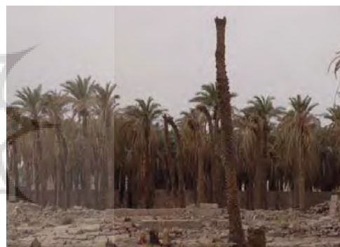
ت ۳. نخلهای خشکیده بم (پس از زلزله).

متأسفانه در روند بازسازی‌ها در شهر بم توجه خاصی به عوامل هویت طبیعی شهر (همچون درختان بابونه‌ای که مانند چتری خیابان‌های شهر را پوشانده بود و نخلستان‌هایی که در اثر عدم آبیاری خشک شده‌اند)، نشده است.