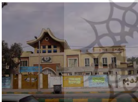
ت ۴. نمونه‌ای از بناهای جدید پس از زلزله در بم.

در محلات مسکونی شهر بم به جز مسجد که فضایی اجتماعی- مذهبی برای ایام و مناسبت‌های مختلف می‌باشند، نقاط عطف و گشودگی‌های مسیر باغ-کوچه‌ها، مکان گردهمایی‌های کودکان و خانم‌ها بودند. (عینی فر، ۸۳، ۳۲)