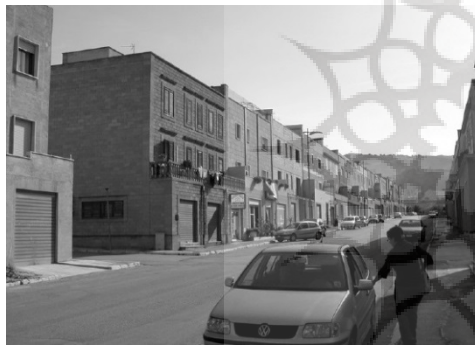
ت ۲. خیابان اصلی در طرح جدید (سیسیلی در غرب ایتالیا).

این سختی تشخیص و شناخت روابط میان فضاهای خصوصی و جمعی در طرح جدید در نهایت منجر شد تا مردم بیش از پیش محیط اطراف خود را نادیده بگیرند؛ محیطی که نهایتاً گمنامی و پوسیدگی و خالی شدن از سکنه بر آن چیره گشت.