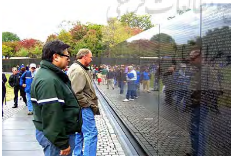
ت ۸. یادبود سربازان ویتنام.

بازسازی‌ها بر پایه دیدگاه‌های بیان شده شکل گرفته‌اند که در ابتدا به آن‌ها اشاره شد و در هیچ کدام از نمونه‌های اشاره شده استراتژی‌های مربوط به حفظ خاطرات جمعی به کار گرفته نشده است و اصولاً مباحثی همچون پیوندهای احساسی با محیط که در اثر وقوع بلایا و حوادث به شدت در ابعاد روانی ساکنان تأثیر گذار است نادیده گرفته شده و در بهترین نمونه‌ها نیز بیشترین تمرکز بر ابعاد کالبدی شهرها بدون توجه به معنای حاصل از آن و نقش هویتی و خاطره‌ای آن معطوف بوده است. نکته قابل توجه این است که این رویکرد در مرمت بافت‌های فرسوده و بازسازی در مراکز شهرها بیشتر به کار گرفته می‌شود؛ نمونه‌ای از این پروژه‌ها، بازسازی مرکز شهر برونوزویل ۲۲ در شیکاگو است که در سال ۱۹۹۴ با هدف بازسازی منطقه براساس تاریخ و حافظه جمعی از طریق نژاد و فرهنگ، آغاز شده بود و منجر به افزایش "حس وابستگی" و "انسجام اجتماعی" و دستیابی به اهداف افزایش مشارکت در این شهر شده است. در نهایت تجربه استفاده از مفهوم حافظه جمعی در برونوزویل موفق به تشکیل تصویر ذهنی در اذهان شهروندان گردید.