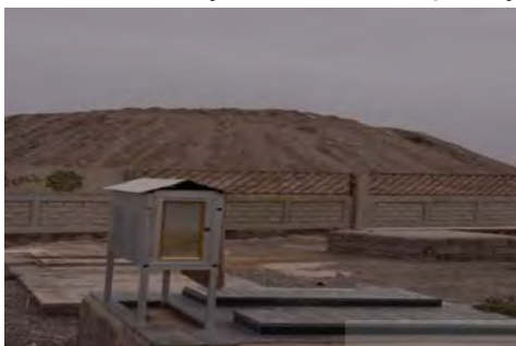
ت ۶. آوارهای باقی مانده از زلزله بم.

شهروندان را کم رنگ تر نمی‌کند، بلکه هر بار خاطرات گذشته را برای بازماندگان این فاجعه بازآفرینی می‌نماید، در حالی که به نظر می‌رسد یکی از مهم ترین اقدامات در مناطق سانحه دیده، تلاش برای از بین بردن خاطره دردناک سانحه و تلاش در جهت تقویت و بازخوانی خاطرات هویت ساز گذشته شهر است.