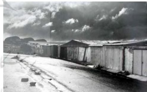
ت ۱. کانکس‌ها برای اقامت ساکنین (سیسیلی در غرب ایتالیا).

بازسازی‌ها در این منطقه از ایتالیا نیز در نهایت با ساخت خانه‌ها و فضاهای شهری جدید آغاز گشت و این در حالی بود که مردمی که در زمان بازسازی‌ها در کانکس‌ها زندگی موقتی داشتند با خاطرات روستای قدیمی خود، رویای شهرهای در حال ساخت و واقعیت‌های زندگی روزانه خود در داخل کانکس‌ها را از بین می‌بردند.