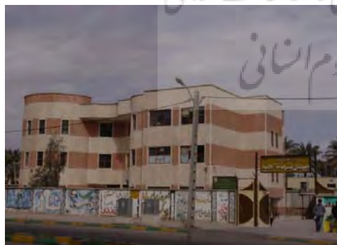
ت ۵. نمونه‌ای از بناهای جدید پس از زلزله در بم.

هدف بازسازی مسکن آسیب دیده در این برنامه چنین بیان شده بود: