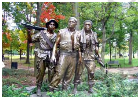
ت ۷. یادبود سربازان ویتنام.

این یادبود در تفرجگاه ملی آمریکا در واشنگتن قرار گرفته که مکانی است برای یادآوری قهرمانان آمریکایی و محلی برای اجتماع عموم مردم و برگزاری جشن‌های آزادی. یادبود سربازان ویتنام متشکل از بخش‌های متفاوتی همچون دیواری از نام‌ها، مجسمه سه سرباز، پرچم و یادبود زنان ویتنام است. این یادبود مکانی است که در آن تمامی افراد، صرف نظر از افکارشان می‌توانند گرد هم آیند تا کسانی را که در جنگ حضور داشته‌اند به یاد آورند و به آنان افتخار کنند. این طرح دارای بسیاری از عناصر سنتی موجود در یادبود جنگ مانند نوشته‌های میهن پرستانه، مجسمه، پرچم و عناصر فیگوراتیو می‌باشد که با هدف بازخوانی خاطرات جمعی طراحی شده‌اند.