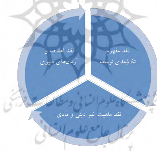
ابعاد نقد الگوهای غربی توسعه در نگاه حضرت آیت‌الله خامنه‌ای

ایشان در جای دیگری درباره پیشرفت در اسلام معتقدند: «البته پیشرفت مادی مطلوب است اما به‌عنوان وسیله. هدف رشد و تعالی انسان است. پیشرفت کشور و تحولی که به پیشرفت منتهی می‌شود، باید طوری برنامه‌ریزی و ترتیب داده شود که انسان بتواند در آن به رشد و تعالی برسد؛ انسان در آن تحقیر نشود. هدف، انتفاع انسانیت است. نه طبقه‌ای از انسان، حتی نه انسان ایرانی. پیشرفتی که ما می‌خواهیم براساس اسلام و با تفکر اسلامی معنا کنیم، فقط برای انسان ایرانی سودمند نیست، چه برسد بگوئیم برای طبقه‌ای خاص. این پیشرفت، برای کل بشریت و برای انسانیت است. نقطه تفاوت اساسی، نگاه به انسان است.» (بیانات در دیدار دانشجویان دانشگاه مشهد، ۱۳۸۶).