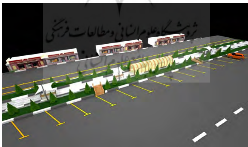
تصویر شماره ۲: طرح پیشنهادی اجرای طرح زندگی شبانه در محدوده مورد نظر