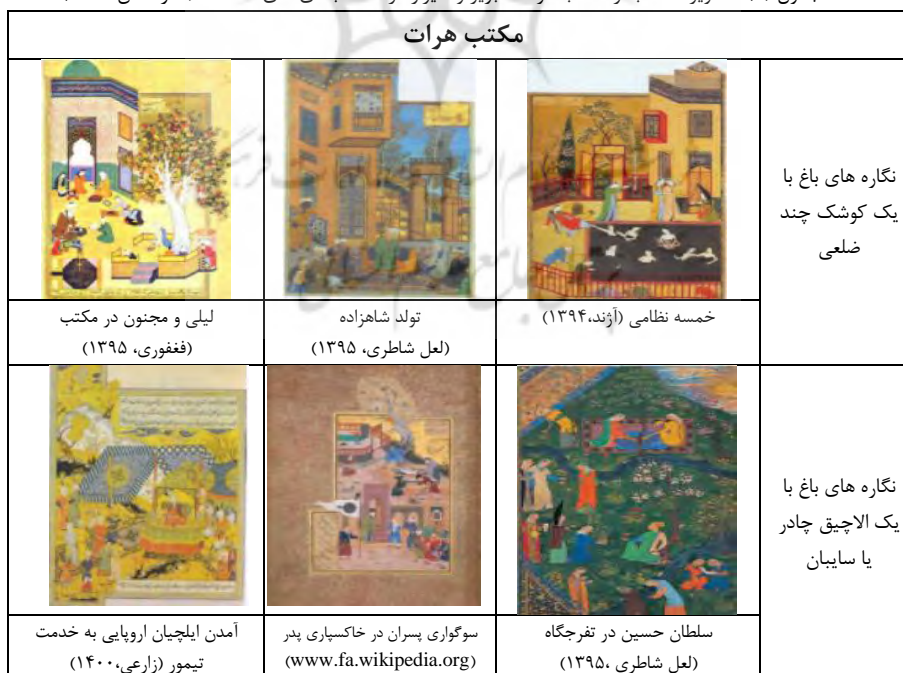
جدول (۳): تصاویر منتخب از مکاتب هرات، تبریز و شیراز در دسته بندی های سه گانه (نگارندگان، ۱۴۰۱)

تصاویر یافته از منابع مختلف در هر مکتب به تفکیک دسته بندی مذکور در جدول شماره (۳) ارائه شده است.