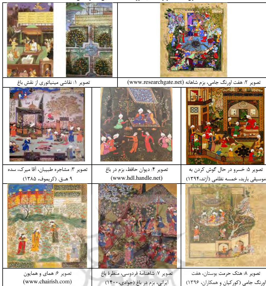
جدول (۲): تصاویر منتخب مورد مطالعه تحقیق (نگارندگان، ۱۴۰۱)

نمونه ۱؛ تصویری است که نشان می‌دهد تذهیب و تشعیر در کجا نوشته و در کجا نقش باغ ترسیم شده است. ذهنیت از باغ ایرانی در هنر مینیاتور بسیار قوی و غنی پرداخته شده است. که حتی از ایران هم فراتر رفته و در کشورهای دیگر هم دیده می‌شود. اگر پلانی هست، درخت را عمومی نشان داده است. اگر خانه ایی ترسیم شده، بیرون، درون و همه بعدهای مختلف هم زمان به نمایش در آمده است. (محمدزاده و نوری، ۱۳۹۶). در این تصویر باغ ایرانی با تمام جزئیات معماری و تزئینات، گیاهان بومی سرزمین مان از درخت و گل، پرندگانی بر شاخسارها و مرغابی ها و ماهی های شناور در آب حوض و فواره و آبنمای موجود در باغ ها، همگی در نقاشی ها دیده می‌شود. نقوش کاشی کاری، تخت گاه و سرپرده های رنگین با نقوش گل و بوته که در باغ ها و زندگی مردم وجود داشته نیز در صحنه های مینیاتور ترسیم شده اند.