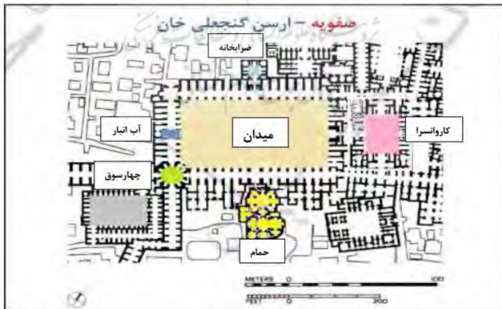
تصویر 1: میدان گنجعلی خان و بناهای اطراف آن، (منبع: شفیعی و همکاران، 1394). تحلیل: نگارنده.