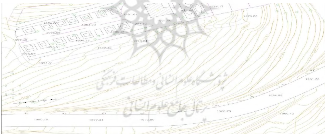
شکل ۲- سایت تپه عباس‌آباد همدان، نگارندگان: اداره راه و شهرسازی استان همدان

همانطور که در تصاویر مشخص است به دلیل بافت زمین و شیب زیاد این منطقه محل قرارگیری مجموعه به گونه ای است که به شیب و بافت زمین آسیب کمتری برسد. سعی بر این است زیبایی این مجموعه گردشگری مورد توجه قرار بگیرد، اولویت بر این بوده که عملکرد مجموعه با توجه به فرم و شیب زمین حداقل آسیب به بافت آن وارد شود و محیط زیست زمین کمتر در معرض خطر قرار گیرد. با توجه به اینکه در این مقاله سعی بر این است که معماری سبز باعث کاهش آلودگی‌های زیست‌محیطی شود، بنابراین طراحی تک تک این مجموعه بر اساس معماری سبز انجام شده و استفاده از بام سبز (روف گاردن) اجرا شده در طراحی مجتمع تفریحی لحاظ شده است. با توجه به اینکه این مجموعه به دو عرصه فرهنگی و گردشگری تقسیم‌بندی می‌شود با توجه به هر عرصه، ریزفضاهایی را ارائه دادیم.