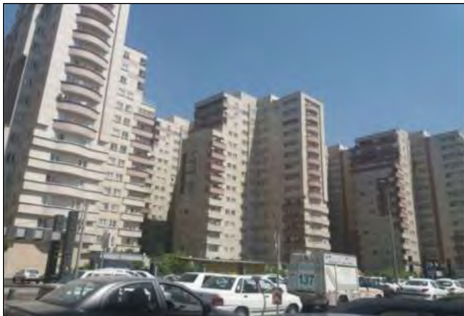
شکل ۵. فروش تراکم مازاد در ناحیه ۷ منطقه ۲ تهران

صدمات و خطرات ناشی از فروش مازاد تراکم و تمرکز آن در منطقه ۲ تهران، در ابعاد و عرصه‌های متعددی قابل طرح است که شرایط نامناسب بر آرامش و سلامتی انسان ساکن در نواحی متراکم و خطرات کالبدی مربوط به سکونت در مکان ناامن (خطر زلزله)، نبود خلوت زندگی، وجود آلودگی صوتی، سکونت در واحدهای مسکونی فاقد امکانات جانبی لازم و ضروری (پارکینگ و انباری)، ناکافی بودن خدمات رفاهی و عمومی در محلات از آن جمله است. آنچه که در شهر بزرگ تهران بطور کلی و در منطقه ۲ تهران به طور ویژه اتفاق افتاده، فاقد ابزار و ساختار لازم (علمی و مطالعاتی، حقوقی، سازمانی و جزء آن) جهت مهار زیاده‌روی بازار زمین و مسکن بوده و کارآمدی لازم را جهت هدایت و مهاربخش خصوصی به سود جنبه‌های مثبت و لازم افزایش تراکم ساختمانی در سطح منطقه نداشته است.