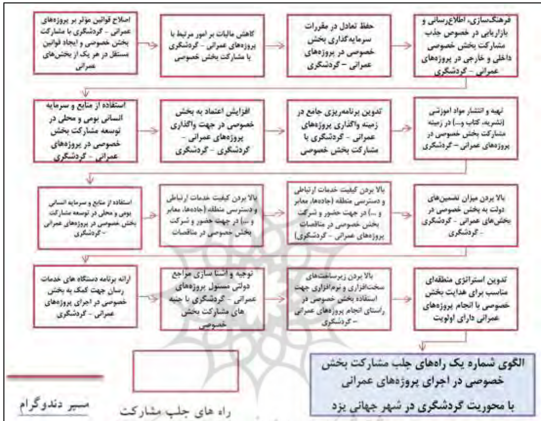
شکل ۶. الگوی شماره یک راه‌های جلب مشارکت بخش خصوصی در اجرای پروژه‌های عمرانی با محوریت گردشگری در شهر جهانی یزد با استفاده از خوشه‌بندی سلسله‌مراتبی (دندوگرام)

(...) در جهت حضور و شرکت بخش خصوصی در مناقصات پروژه‌های عمرانی - گردشگری؛ بالا بردن میزان تضمین‌های دولت به بخش خصوصی در بخش‌های عمرانی - گردشگری - گردشگری؛ ارائه برنامه دستگاه‌های خدمات رسان جهت کمک به بخش خصوصی در اجرای پروژه‌های عمرانی - گردشگری؛ توجیه و آشنا سازی مراجع دولتی مسئول پروژه‌های عمرانی - گردشگری با جنبه‌های مشارکت بخش خصوصی؛ بالا بردن زیرساخت‌های سخت‌افزاری و نرم‌افزاری جهت استفاده بخش خصوصی در راستای انجام پروژه‌های عمرانی - گردشگری؛ و تدوین استراتژی منطقه‌ای مناسب برای هدایت بخش خصوصی با انجام پروژه‌های عمرانی دارای اولویت هستند که طبق شکل ۶ ارزیابی و اولویت‌بندی و چیدمان شده‌اند.