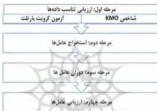
شکل ۴. مراحل انجام تحلیل عاملی

که در آن: W بیانگر ضرایب نمره عوامل و P معرف تعداد متغیرهاست. مبانی ریاضی تحلیل عاملی، برحسب مقدار و نوع واریانس هر متغیر X_j که توسط عامل‌های موجود در مدل توجیه می‌شود، متفاوت است (Isfahanian, 2015:63-67). مراحل اجرای تحلیل عامل در این تحقیق طبق شکل (۴) است که به گام به گام پیش رفته است.