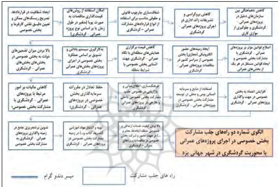
شکل ۷. الگوی شماره دو راه‌های جلب مشارکت بخش خصوصی در اجرای پروژه‌های عمرانی با محوریت گردشگری در شهر جهانی یزد با استفاده از خوشه‌بندی سلسله‌مراتبی (دندوگرام)

ایجاد قوانین مستقل در هر یک از بخش‌های عمرانی؛ کاهش مالیات بر امور مرتبط با پروژه‌های عمرانی - گردشگری با مشارکت بخش خصوصی؛ حفظ تعادل در مقررات سرمایه‌گذاری بخش خصوصی در پروژه‌های عمرانی - گردشگری؛ فرهنگ‌سازی، اطلاع‌رسانی و بازاریابی در خصوص جذب مشارکت بخش خصوصی داخلی و خارجی در پروژه‌های عمرانی - گردشگری؛ استفاده از منابع و سرمایه انسانی بومی و محلی در توسعه مشارکت بخش خصوصی در پروژه‌های عمرانی - گردشگری؛ افزایش اعتماد به بخش خصوصی در جهت واگذاری پروژه‌های عمرانی - گردشگری؛ تدوین برنامه‌ریزی جامع در زمینه واگذاری پروژه‌های عمرانی - گردشگری به مشارکت بخش خصوصی؛ تهیه و انتشار مواد آموزشی (نشریه، کتاب و...) در زمینه مشارکت بخش خصوصی در پروژه‌های عمرانی - گردشگری؛ بالا بردن کیفیت خدمات ارتباطی و دسترسی منطقه (جاده‌ها، معابر و...) در جهت حضور و شرکت بخش خصوصی در مناقصات پروژه‌های عمرانی - گردشگری که طبق شکل ۷، ارزیابی و اولویت‌بندی و چیدمان شده‌اند.