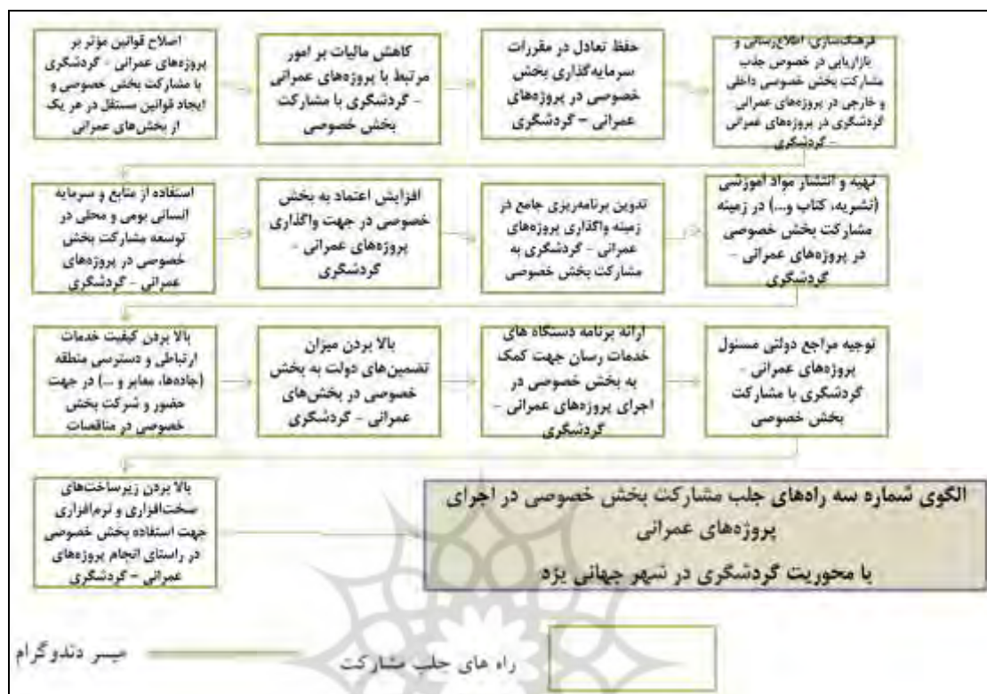
شکل ۸. الگوی شماره سه راه‌های جلب مشارکت بخش خصوصی در اجرای پروژه‌های عمرانی با محوریت گردشگری در شهر جهانی یزد با استفاده از خوشه‌بندی سلسله‌مراتبی (دندوگرام)

عمرانی - گردشگری؛ توجیه مراجع دولتی مسئول پروژه‌های عمرانی - گردشگری با مشارکت بخش خصوصی؛ بالا بردن زیرساخت‌های سخت‌افزاری و نرم‌افزاری جهت استفاده بخش خصوصی در راستای انجام پروژه‌های عمرانی - گردشگری که طبق شکل ۸، ارزیابی و اولویت‌بندی و چیدمان شده‌اند.