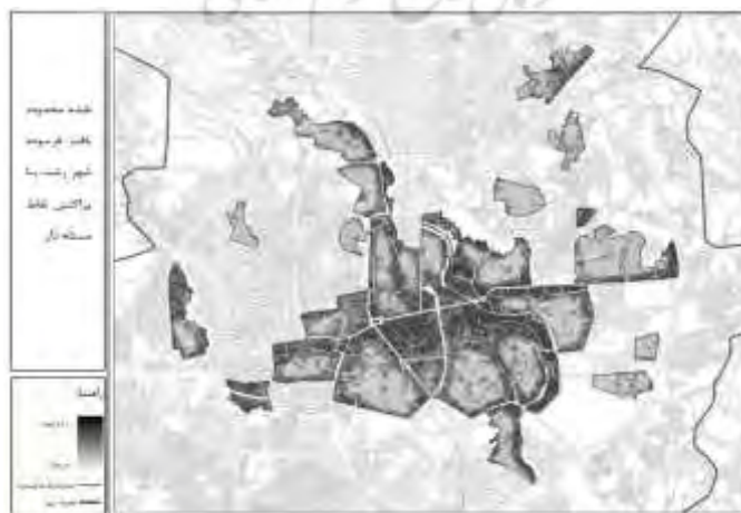
شکل ۱. نقشه محدوده بافت فرسوده شهر رشت (مهندسين مشاور كههندز: ۱۳۹۱: ۵۶)

شهر رشت به‌عنوان مرکز استان گیلان در مرکز جلگه گیلان، در وسیع‌ترین بخش دلتای رودخانه سفیدرود با ارتفاع متوسط ۸ متر از سطح دریاها و آزاد و در انتهای راه کناره اصلی دریای خزر و در مسیر راه اصلی درجه‌یک قزوین به بندر انزلی واقع شده است. بر اساس سرشماری سال ۱۳۹۵، دارای ۶۷۶۹۹۱ نفر جمعیت بوده است (Statistical Center of Iran, 2016). با این وجود با توجه به کلان‌شهر و مرکز استان بودن این شهر، با جذب جمعیت روزانه، جمعیت شناور روزانه این شهر بیشتر از یک میلیون نفر است و حتی در ایام تعطیلات نوروزی و گاه‌تعطیلات رسمی، با ورود گردشگران، این جمعیت به بیش از دو میلیون نفر نیز می‌رسد. محدوده مصوب بافت فرسوده شهر رشت مطابق آخرین طرح جامع (۱۳۸۴) پس از تصحیح از مساحتی حدود ۸۳۲/۱ هکتار برخوردار بوده است که ۱۳۳/۷ هکتار نیز - پس از شناسایی بلوک‌های واجد سه معیار - به آن افزوده شده است.