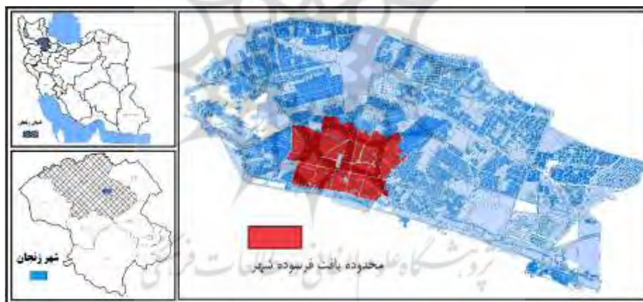
شکل ۲. جایگاه محدوده مورد مطالعه در تقسیمات کشوری

شهر زنجان در شمال غرب کشور و مرکز استان زنجان قرار دارد. جمعیت شهر ۴۳۱۷۸۰ نفر است. بافت فرسوده شهر زنجان به عنوان قلمرو تحقیق، در بخش مرکزی و قدیمی شهر زنجان قرار دارد. این محدوده با مساحت ۴۹۲ هکتار، تقریباً 7/97 درصد از کل مساحت شهر (۶۱۶۹/۷۷ هکتار) را شامل می‌شود (مهندسی مشاور آرمانشهر، ۱۳۸۸: ۲۷).