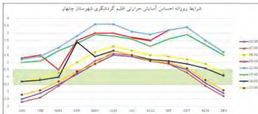
شکل ۳. شرایط روزانه احساس آسایش حرارتی اقلیم گردشگری شهرستان چابهار