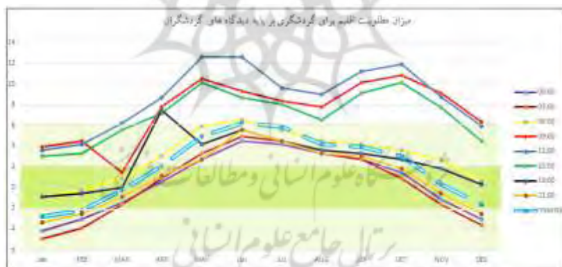
شکل ۵. میزان مطلوبیت شرایط اقلیمی برای گردشگری بر اساس شاخص بازبینی شده CIT

بررسی روند ماهانه مطلوبیت اقلیم گردشگری (شکل ۵) نشان می‌دهد که به جز ماه ژوئن، سایر ماه‌های سال بندرچابهار، در شرایط مطلوب یا قابل قبول برای گردشگری قرار دارد و ماه‌های ژانویه تا مارس و ماه‌های نوامبر و دسامبر، دارای شرایط مطلوب و ایده‌آل برای گردشگران محسوب می‌شود. همچنین ماه‌های گرم سال، خارج از محدوده مطلوب قرار داشته و در شرایط قابل قبول یا قابل تحمل قرار دارند. در طول یک شبانه روز نیز، ساعات بامداد و شب (۱۸ و ۲۱ و ۳) از شرایط بهتری برای گردشگری برخوردار هستند و غیر از ماه ژوئن مقطع زمانی ۶ صبح و ماه آوریل ساعت ۱۸، کلیه ماه‌ها در زمان‌های فوق‌الذکر، در شرایط مطلوب یا قابل قبول قرار دارند و البته همان‌طور که انتظار می‌رفت، ماه‌های سرد سال در شرایط مطلوب و ماه‌های گرم عمدتاً در شرایط قابل قبول قرار دارند. به طور کلی ساعات ۲۱ و ۳ مطلوب‌ترین ساعات برای گردشگران در طول شبانه روز می‌باشد، این در حالی است که ساعات روزانه (مقاطع زمانی ۹، ۱۲ و ۱۵) عمدتاً ساعات نامناسبی برای گردشگری به شمار می‌روند و به جز ماه‌های سرد سال که کمی قابل تحمل هستند، در سایر ماه‌ها، شرایط نامطلوبی را برای گردشگران به همراه دارند. مقایسه نتایج شاخص