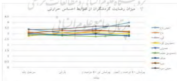
شکل ۴. ارزیابی میزان رضایت گردشگران از شرایط اقلیمی

نتایج نظرسنجی و ارزیابی تجربی، حاوی نکات قابل توجه است. ابتدا اینکه هیچ یک از شرایط اقلیمی با احساس حرارتی مختلف، رضایت بسیار زیاد و شرایط ایده آل را برای گردشگران فراهم نمی‌کند، بلکه در بهترین شرایط، رضایت نسبی و شرایط خوب را موجب می‌شود. متعاقب آن، گردشگران نسبت به هیچ یک از شرایط مختلف اقلیمی، ناراضی نیستند و در بدترین شرایط اقلیمی نیز نسبت به وضعیت محیطی، بی‌تفاوت هستند. این مسئله می‌تواند نشانگر انعطاف‌پذیری بالای گردشگران نسبت به شرایط محیطی،