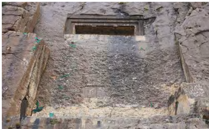
تصویر ۱. گوردخمه دکان داود یا کل داو (نگارندگان)