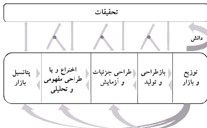
شکل ۲) مدل تعاملی فرآیند نوآوری: مدل زنجیره‌ای به هم پیوسته [۸]

تلاش‌های اولیه برای نشان دادن بازخوردهای سیستمی در فرآیند نوآوری توسط کلاین و روزنبرگ ۱ در سال ۱۹۸۶ و تحت عنوان مدل زنجیره‌ای به هم پیوسته ۲ صورت گرفت [۸]. مدل زنجیره‌ای به هم پیوسته از یک طرف فرآیندهای درونی یک بنگاه یا شبکه‌ای از بنگاه‌ها که با یکدیگر در تعامل هستند را مشخص می‌سازد و از طرف دیگر روابط میان بنگاه و نظام گسترده‌تر علم و فناوری را به تصویر می‌کشد. این موضوع می‌تواند به عنوان تعریفی از "سیستم" قلمداد شود که بر خلاف برخی نظریه‌ها هیچ چشم‌انداز اقتصادی، سیاسی، اجتماعی و فرهنگی را منعکس نمی‌کند. در واقع آنها به روشنی بیان کردند که مدل‌های خطی در عمل وجود نداشته‌اند و هر آنچه در حوزه نوآوری اتفاق افتاده حاصل جفت شدن فناوری جدید با نیاز بازار بوده است. چه بسا