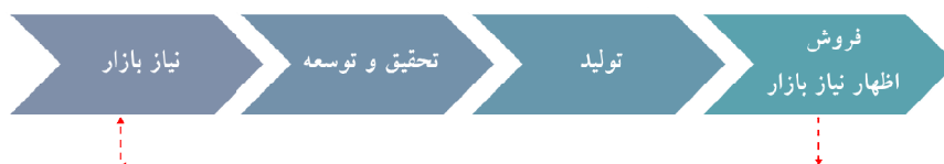
شکل ۱) مدل‌های فشار فناوری و کشش بازار

مدل‌های وابسته به مسیر نیز بر اساس این ایده که نوآوری و استفاده از فناوری جدید به مسیر توسعه آن بستگی دارد شکل گرفتند. وابستگی مسیر توضیح می‌دهد که چگونه مجموعه‌ای از تصمیماتی که یک فرد یا بنگاه در شرایط خاص با آن مواجه می‌شود به تصمیماتی که در گذشته اتخاذ شده ارتباط دارد. این رویکرد به مفهوم انباشت دانش و تجربه نیز اشاره می‌کند و مباحثی مانند اثر فرآیندهای یادگیری از طریق تجربه و تحقیقات در کاهش هزینه‌ها را مورد بحث قرار می‌دهد [۵].