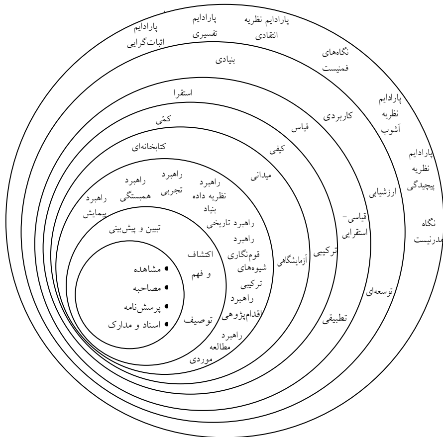
شکل ۱) پیاز فرایند پژوهش [۱۸]

با این اوصاف، برای تولید دانش علمی هر دو محور کار و تعامل ارتباطی ضروری‌اند و فروکاستن یکی به سود دیگری روا نیست. بر این اساس، تولید دانش تلاشی است گروهی که در گذر زمان شکل می‌گیرد. پژوهشگر با تکیه بر مأخذ مفهومی و حالات اندیشیدن و زبان محافل علمی خود که آن نیز در بستر تاریخ شکل گرفته است، پژوهش خود را انجام می‌دهد. در مطالعات علوم انسانی، موضوع مطالعه «موضوع اجتماعی - انسانی» است. بنابراین، رابطه میان پژوهشگر و پدیده در دست مطالعه نیز اجتماعی است. خود پدیده‌های اجتماعی که از بطن روابط انسان‌ها نیز ساطع می‌شوند، به صورت اجتماعی تعریف می‌شوند [۱۹]. جامعه مهم‌ترین و اصلی‌ترین مکان پدیده مورد بررسی پژوهشگر علوم انسانی است. سازمان‌ها موضوعات اجتماعی‌اند، بنابراین «محافل زبانی ۱» را شکل می‌دهند؛ یعنی محفلی که زبان خاصی دارند. بدین ترتیب، بین هر محفل پژوهشی (برای مثال، محافل پژوهشگران اجتماعی) و موضوع اجتماعی مورد مطالعه (برای مثال، سازمان) نوعی تقارن مفهومی وجود دارد (شکل ۲).