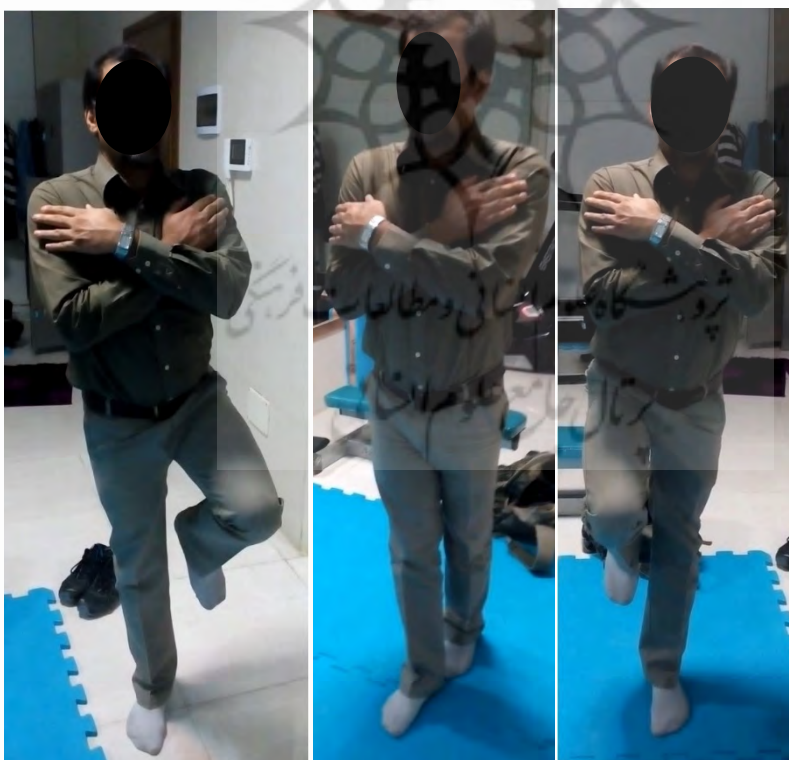
شکل ۲. تمرینات تعادلی تک پا انجام گرفته توسط گروه تعادل بر روی سطوح سخت و نرم