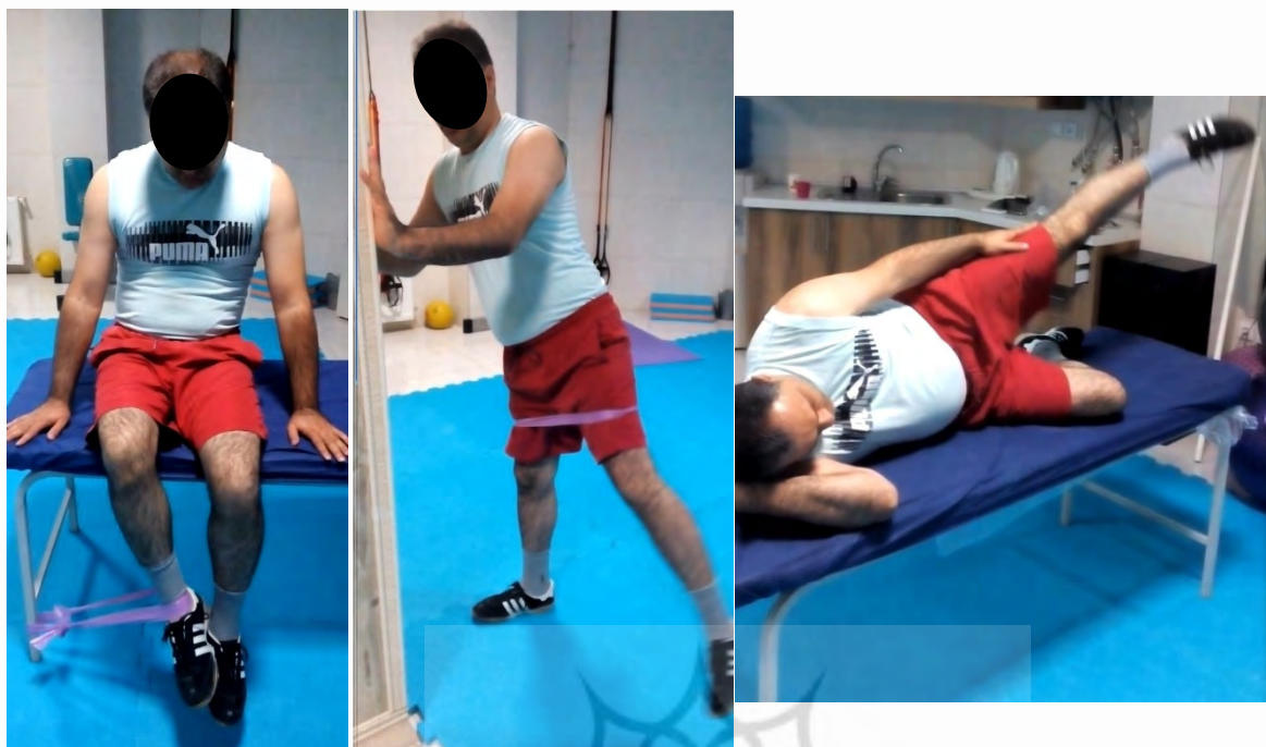
شکل ۱. تمرینات دور کردن و چرخش خارجی ران به وسیله باندکشی