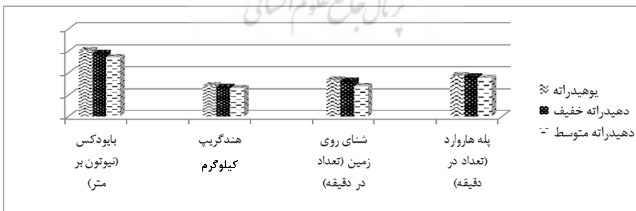
شکل ۲. مقایسه تغییرات قدرت و استقامت عضلانی و اندام فوقانی و اندام تحتانی در سه شدت مختلف هیدراسیون

در توان بی هوازی نیز، بین هر سه حالت یوهیدراسیون- متوسط ( p=0.0001 ) و دهیدراسیون خفیف- دهیدراسیون دهیدراسیون خفیف ( p=0.0001 )، یوهیدراسیون- دهیدراسیون متوسط ( p=0.003 ) تفاوت معنی داری مشاهده گردید.