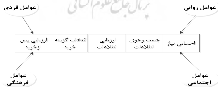
شکل ۱: چارچوب مفهومی پژوهش

فرایند رفتار مصرف‌کننده نسبت به تبلیغات در وبلاگ‌های فشن در خلأ رخ نمی‌دهد و عوامل چندی بر این فرایند اثرگذار می‌باشد. با توجه به ادبیات مرتبط با موضوع و مدل‌های تبلیغاتی در این زمینه، چارچوب مفهومی پژوهش در نگاره شماره ۱ ارائه شده است. این چارچوب عواملی را که بر فرایند رفتار مصرف‌کننده اثرگذار است، نشان می‌دهد. همانطور که مشاهده می‌کنید مدل رفتار مصرف‌کننده چهار جزء اصلی عوامل روانی، فردی، اجتماعی و فرهنگی هستند؛ که این عوامل در برگیرنده اجزایی است که در شکل شماره دو اجزای مرتبط با عوامل مؤثر بر نگرش نسبت به تبلیغات در وبلاگ‌های فشن نشان داده شده است. در پژوهش حاضر نیز مبنای طراحی سوالات مصاحبه، ترکیب مدل مذکور و فرایند تصمیم‌گیری خریدار به شرح نگاره زیر است.